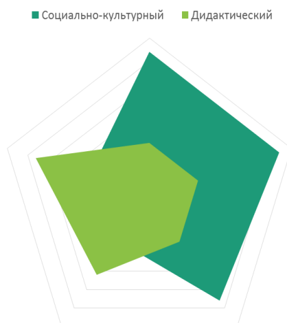
Рис.4. Результаты мониторинга сайтов школ

В связи с бурным развитием информационных технологий роль официальных сайтов в деятельности образовательных учреждений возрастает. Большинство сайтов являются презентационными, представляют основную информацию о данной организации: персоналиях директора, учителей и обучающихся, сведения о планах и мероприятиях. В современных условиях требования к веб-сайту образовательного учреждения значительно расширяются, всестороннее освещение образовательной, научно-методической, общественной деятельности учебного заведения, обмен опытом, творческими идеями, достижениями, формами и методами работы. Сайт должен обеспечивать расширение образовательных возможностей обучения, отражение деятельности участников педагогического процесса, для внешних посетителей сети Интернет, информационной поддержки обучающихся и педагогов, проведение конкурсов и опросов.