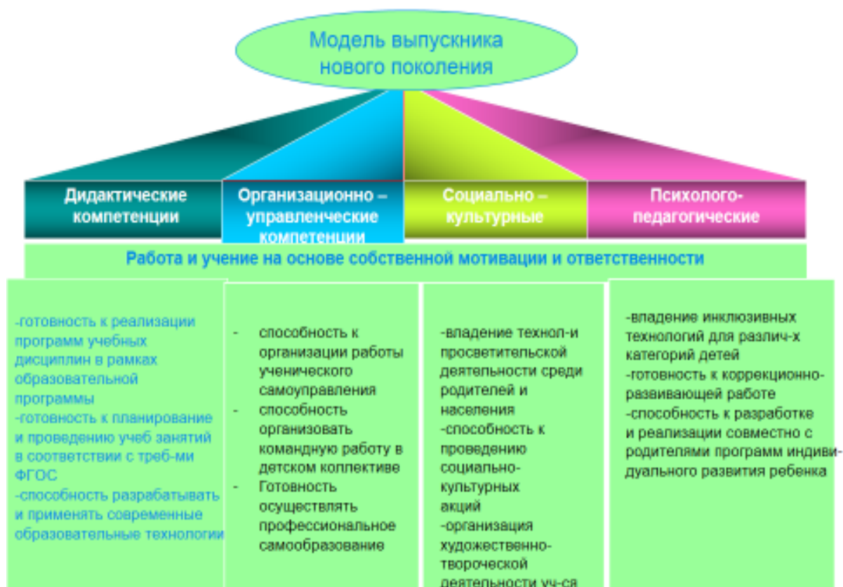
Рис. 3. Компетентностная модель на основе профессионального и государственного образовательного стандарта

На сегодняшний день существует достаточно много взглядов на то, какой должна быть компетентностная модель современного учителя. Универсальной модели нет и это правильно. Перечень компетенций учителя достаточно объемный, и каждая школа может добавить те из них, которые считает наиболее важными для достижения тех или иных образовательных результатов. Главное помнить, что уровень сформированности профессиональных компетенций современного учителя должен быть достаточным для создания такой образовательной развивающей среды, в которой возможно формирование ключевых компетенций учащихся.