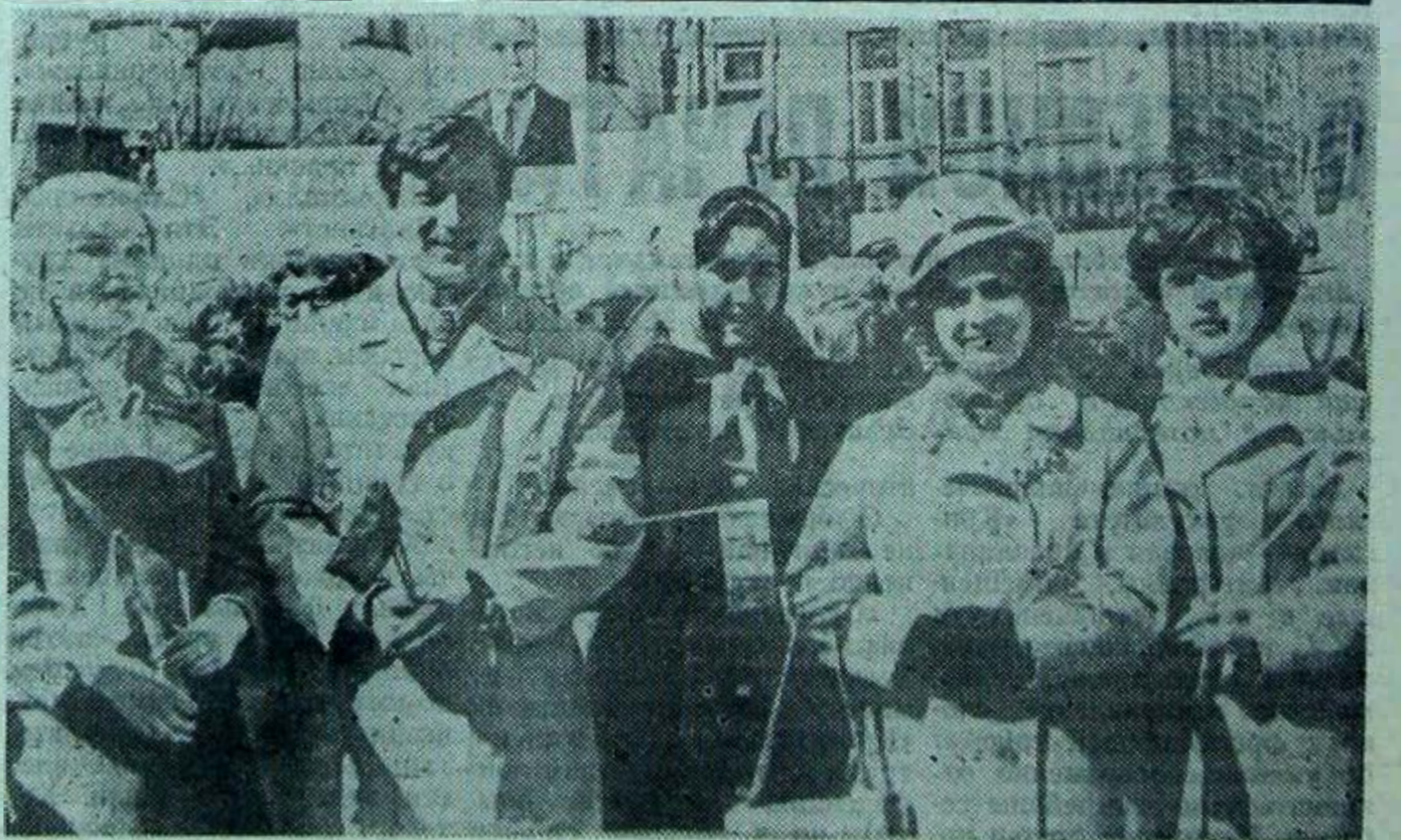
Выпускники исторического отделения на демонстрации

Переходящий кубок был вручен победителю соревнований — команде нашего университета, второе место заняли спортсмены индустриального института, третье — инженерно-строительного.