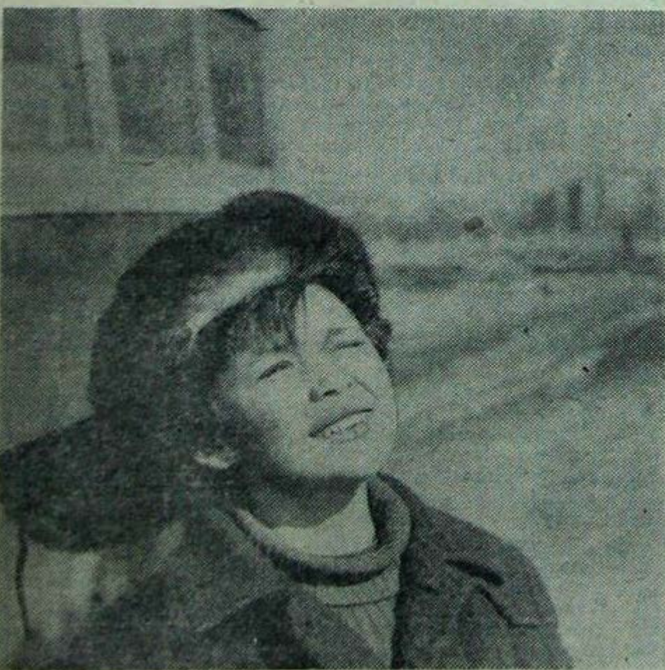
«Я вижу солнце!».