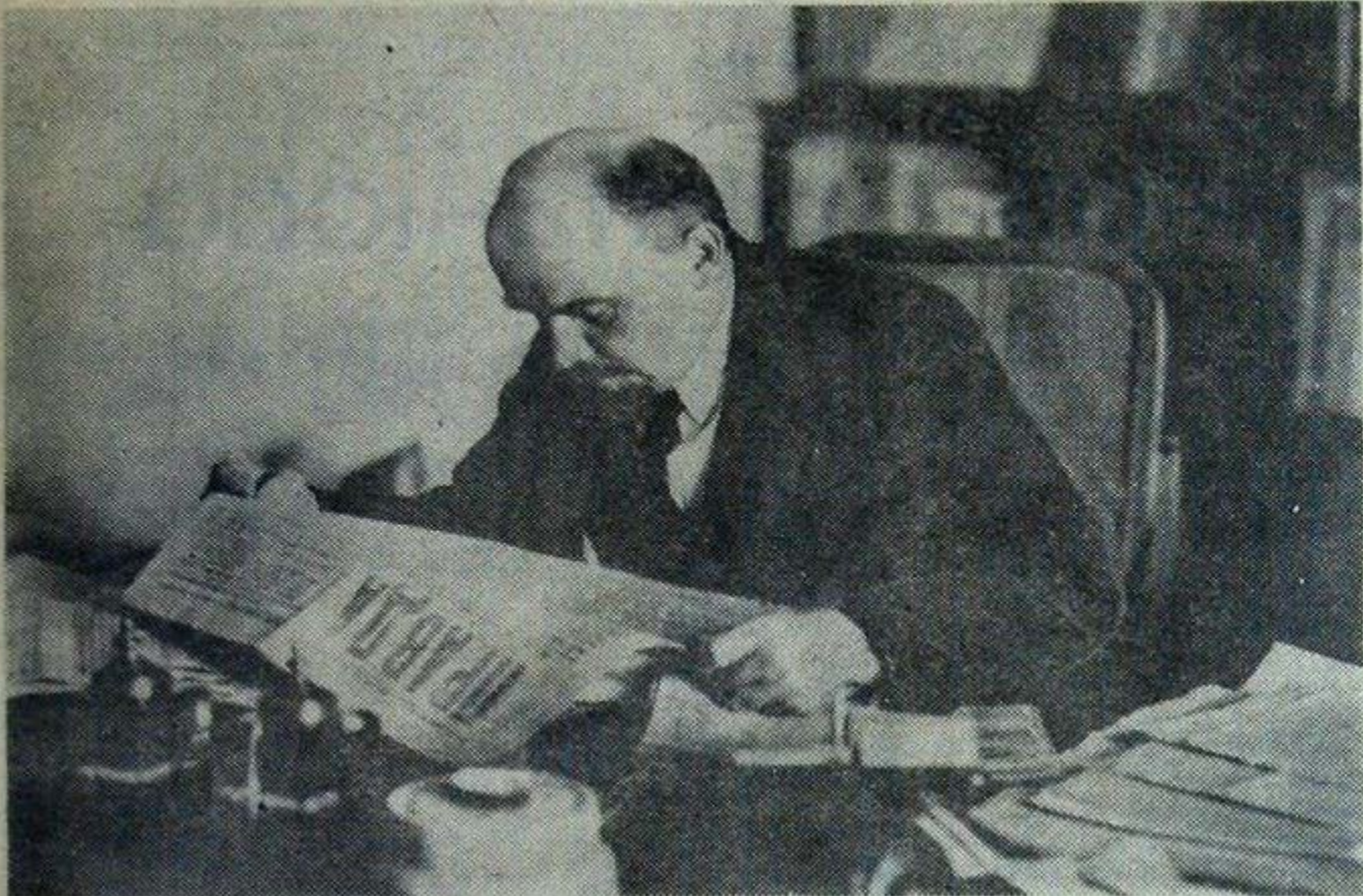
В. И. Ленин в своем кабинете в Кремле.