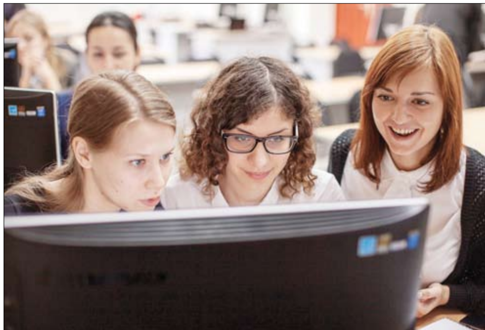
Студенты на фестивале журналистских работ «Медианавигатор»