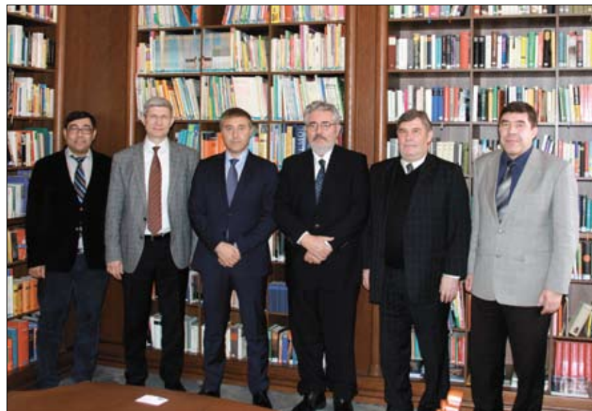
Встреча с ректором и проректором по науке ТюмГУ

И конечно же, гости с удовольствием осмотрели исторические места Тюмени.