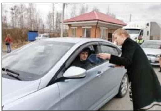
Акция по безопасности дорожного движения совместно с ГИБДД

Работа кафедры общей и социальной психологии ТюмГУ по продолжению профилактических мероприятий, направленных на предотвращение социального и мобильного мошенничества, терроризма и экстремизма, правового нигилизма, продолжается. Обсуждаются критерии общественной оценки деятельности правоохранительных органов.