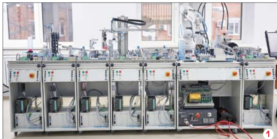
Учебный комплекс «Мехатроника MPS 210» (Фото 1)

В Техноцентре ТюмГУ установлено новое суперсовременное лабораторное оборудование по мехатронике и робототехнике. Все оборудование промышленное, т.е. состоит из тех же компонентов, что используются в производстве. Для решения любых задач можно различным образом совмещать и объединять компоненты.