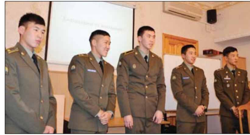
Творческая группа курсантов ТВВИКУ из Монголии

году в конкурсной программе участвовали две команды, которые презентовали совершенно разные, но равно интересные труды. «Антисловарь «Монголрус»» доказал участникам круглого стола, что можно «выучить иностранный язык без труда».