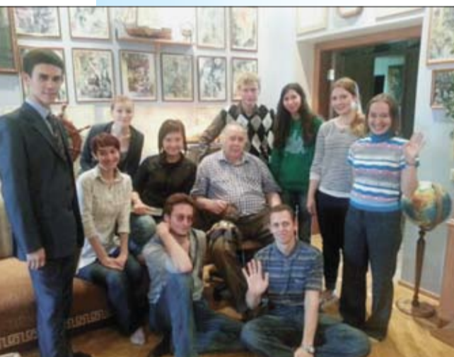
С Владиславом Крапивиним, 2013 год.