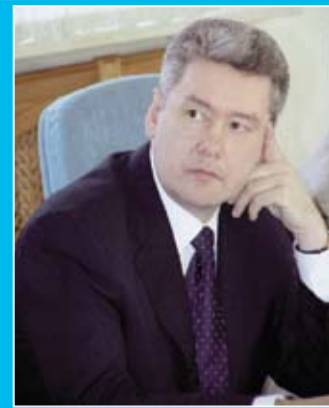
Губернатор Тюменской области (2001—2005 г.г.), кандидат юридических наук С.С. Собьянин