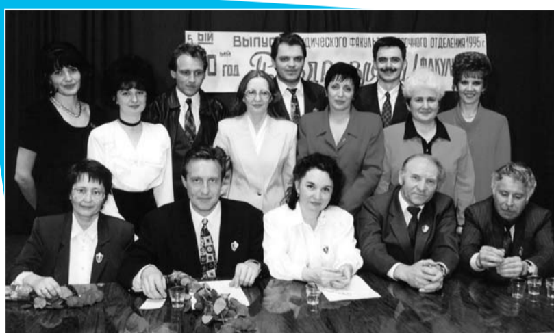
Выпуск заочного отделения юридического факультета, 1995 г.