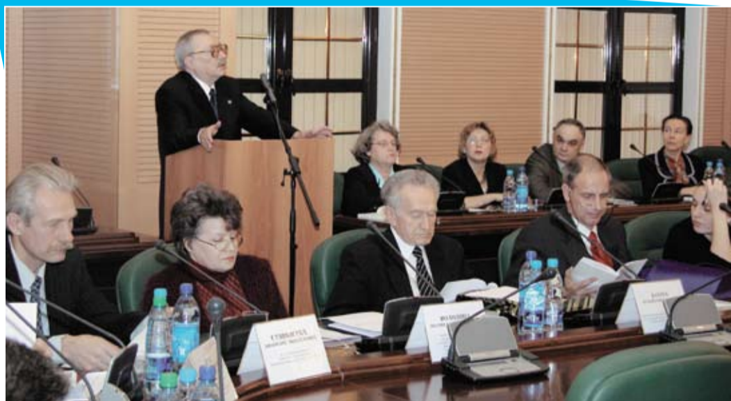
Международная научно-практическая конференция «Судебная власть: закон, теория, практика»