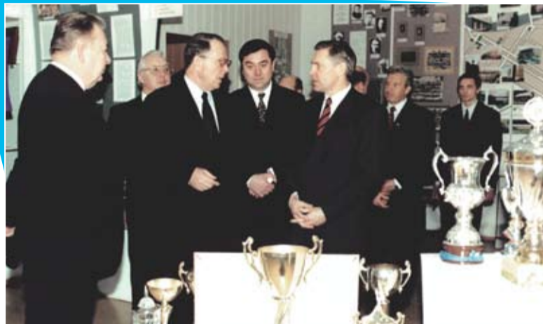
Министр образования РФ в 2000 – 2004 г.г. В.М.Филиппов (крайний справа) в ИГиПе