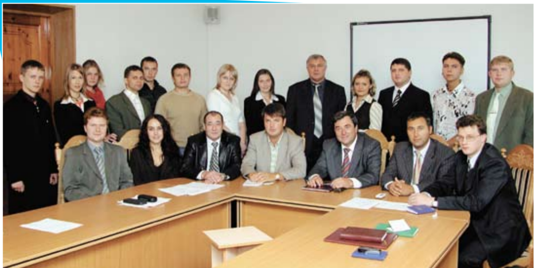
Кафедра конституционного и муниципального права, 2005 год