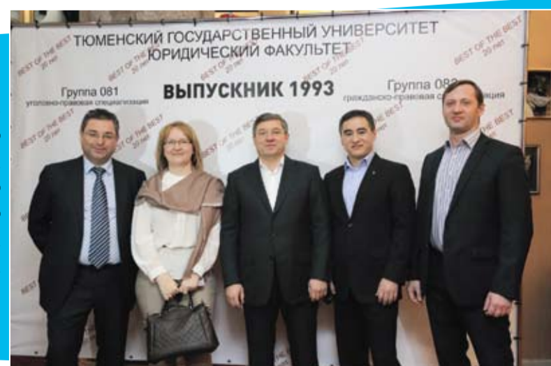
Встреча выпускников юридического факультета Тюменского государственного университета 1993 года