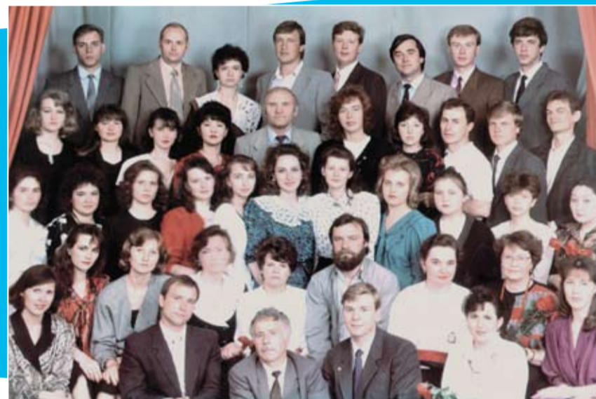
Студенты и их любимые преподаватели