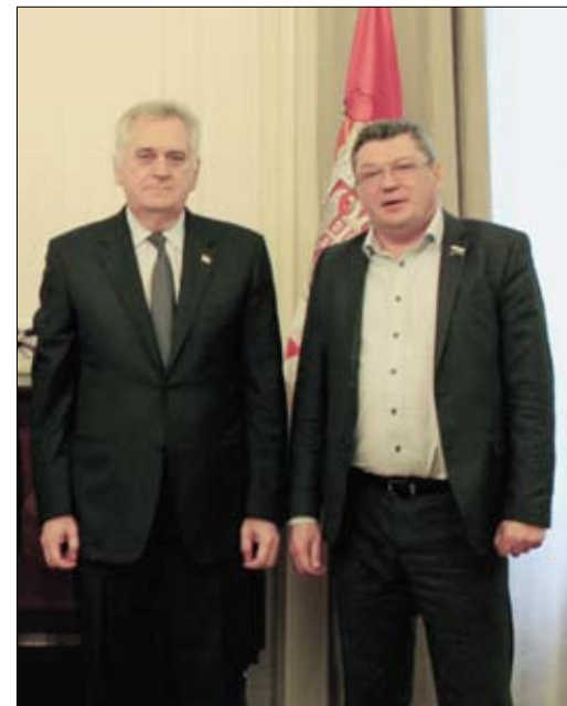
С президентом Сербии Томиславом Николичем