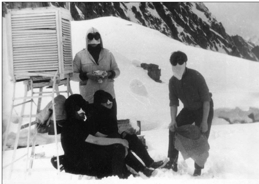
Ледник Кара-Баткак. 2-я метеоплощадка. 9 мая 1970 года

Мне стали снится страны, земли, Дороги, дали и пути. Меня желание объемлет В уединение уйти. Услышать птиц, увидеть снова, Как зори утра хороши,