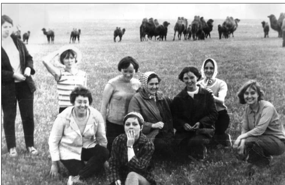
В казахстанских степях