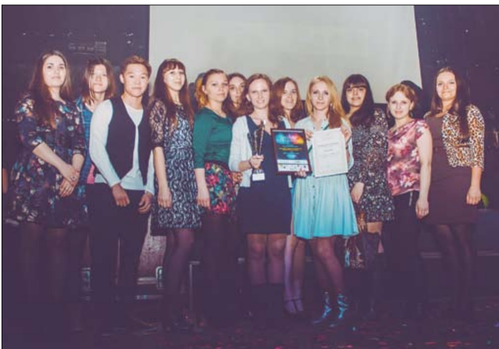
И ее любимая группа

– Если вы любите естественные науки, полевые практики, теплую и домашнюю атмосферу, то советуем поступать к нам, в Институт биологии. Хотя наш институт не очень большой, в этом есть свои плюсы, все друг друга знают, готовы помочь и поддержать. Есть большое количество современных оборудованных лабораторий. Отличный преподавательский состав. В Институте активно развивается студенческое самоуправление. Будем рады видеть вас!