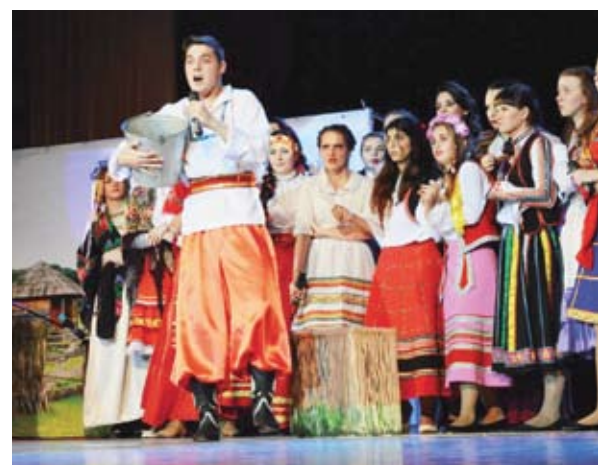
Институт филологии и журналистики: жизнь и сцена