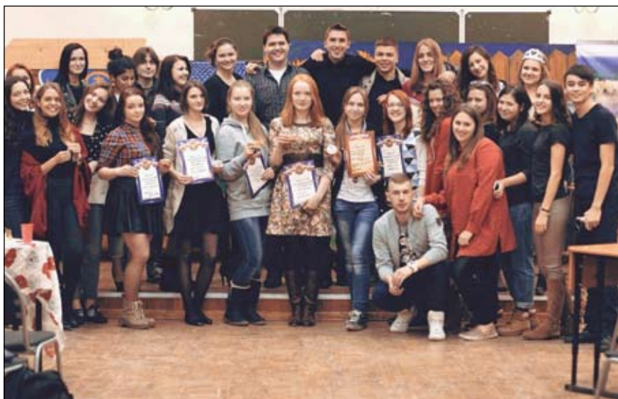
Институт филологии и журналистики: жизнь и сцена