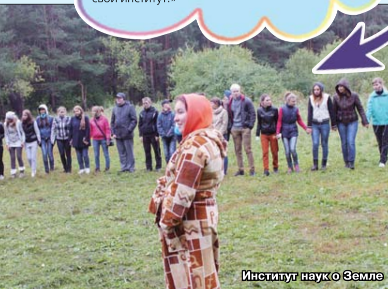
Институт наук о Земле

«В нашем институте посвящение было очень интригующим: никто не знал, что будет, все пугали друг друга догадками и домыслами. На самом деле все было очень таинственно: кругом мрак, свечи, непонятные фигуры. С завязанными глазами нужно было идти вперед через темноту за своими проводниками. Смысл всего посвящения состоял в том, что мы были слепы, и нам пришлось слышать и слушать, чувствовать и доверять. И вот мы шли сквозь тьму, потом оказались на дорожке из горящих свечей, где нас приветствовало студенческое братство института. Я был посвящен в студенты ТюмГУ и никогда не забуду этот момент! Спасибо моему институту за добрую атмосферу!»