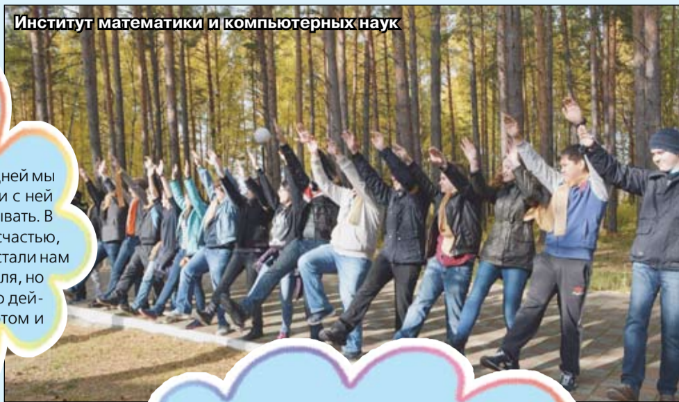
Институт математики и компьютерных наук

«В первый месяц учебы в университете мы действительно попали в круговорот событий: одно мероприятие сменялось другим. Самым запоминающимся был Фестиваль первокурсников. Буквально за 10 дней мы должны были сдружиться с другой группой, найти с ней общий язык, решить, что именно мы будем показывать. В первый день это казалось нереальным. Но, к счастью, у нас все получилось, и новые ребята стали нам не только коллегами на время фестиваля, но и друзьями. А когда вышли на сцену, то действительно поймали драйв. Я думаю, в этом и была цель всего мероприятия: раскрыть себя».