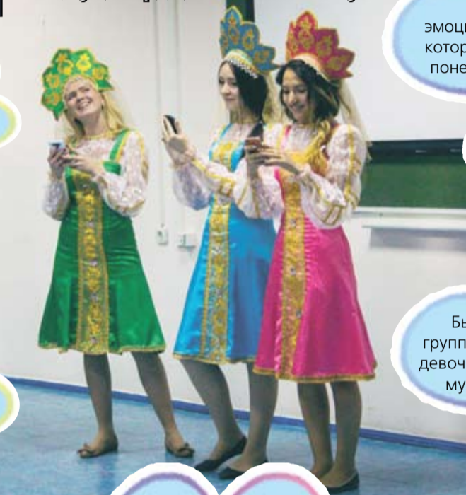
Институт истории и политических наук

«26 сентября в нашем институте состоялось событие месяца - Кубок первокурсника! Все группы показали достойные выступления, но именно моя группа оказалась лучшей. Все было настолько весело, органично и по-домашнему, что первокурсники почувствовали себя одной большой семьей! Спасибо кураторам и всем участникам за необычайную атмосферу!»