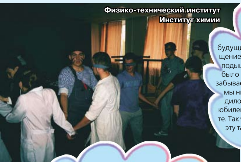
Физико-технический институт Институт химии

В каждом институте ТюмГУ существуют собственные традиции и ритуалы, которые приобретают особую таинственность в начале учебного года. Мы спросили у первокурсников, как и в какой форме прошло их посвящение. Они поделились с нами не только своим мнением, но и фотографиями, отражающими суть всего процесса. Поэтому смысл данной игры - соотнести каждое впечатление студента с изображением и названием института, в котором он учится. Будьте внимательны: в текстах содержится больше подсказок, чем на фото. Ответы в следующем номере.