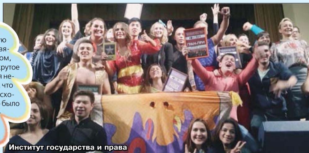
Институт государства и права

«Все было так классно! Советую будущим первокурсникам ехать на посвящение обязательно: побываете за городом, подышите свежим воздухом! Все самое крутое было вечером - сам процесс посвящения не забываем. Но кураторы взяли с нас клятву, что мы никому не расскажем, что там произошло, как бы странно это не звучало. Это было юбилейное посвящение в нашем институте. Так что, похоже, нам придется хранить эту тайну до следующего юбилея!»