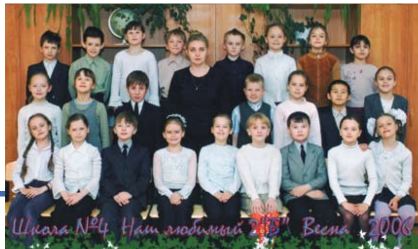
Школа №4 Нам любимой 2015 Весна 2008