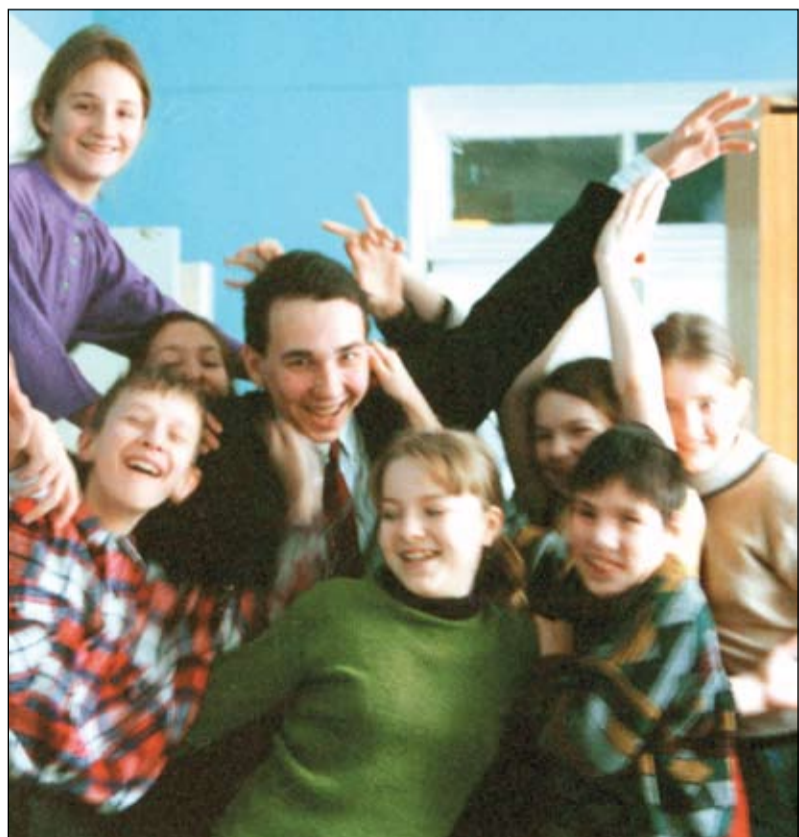
Классный руководитель и его дети

- Всё-таки о том, что нравится, говорить приятнее. К тому же это трудный вопрос, очень общий. Мне не нравится встречаемое мной иногда неуважение, невежество, боязнь «как бы чего не вышло». Хочется, чтобы школа была более самостоятельной, более ответственной, более свободной. Хочется в школе видеть человеческие лица, смотрящие друг на друга, а не на горы бумаг, за которые мы учителя ругаем, но покорно заполняем так, будто мы и не учителя, а служащие бюрократии. Хочется, чтобы опыты по физике, химии, биологии не заменялись компьютерными презентациями, чтобы информационные технологии облегчали течение информационных потоков в организационной и управленческой работе, а не ложились тяжким бременем на плечи моих коллег. Много хочется. Поэтому и работаем, чтобы сделать так, как хочется.