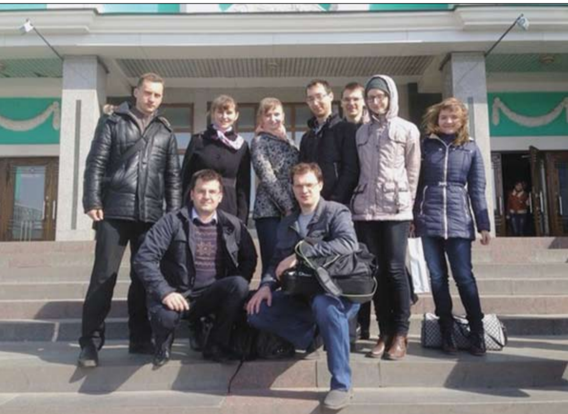
С победой домой (II тур Всероссийской юридической олимпиады, г. Омск)

- Кто готовит ребят к олимпиаде? - Подготовка ребят начинается во время учебных занятий, как правило, на семинарах, где будущие олимпиадники заявляют о себе. Таких ребят мы стараемся не упускать из виду и предлагаем им участвовать в различного рода заседаниях научных кружков, круглых столах и конференциях. В дальнейшем мы выходим