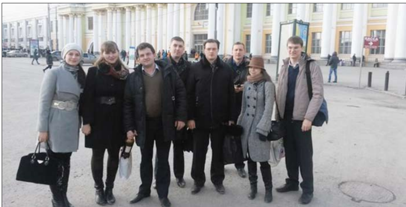
Команда ИГиПа ТюмГУ на II туре Всероссийской студенческой олимпиады (г. Екатеринбург)

повестку. Взяв это дело в производство, увидел, что она находится в розыске, поехал в суд. Написал от её имени ходатайство, в котором было сказано, что вот узнала, что нахожусь в розыске, хочу прийти с повинной, вернуть долг потерпевшим. Поднял розыскное дело, увидел, что в нём всего две бумажки. Никто девушку не искал. Начался процесс. Правда, я её убедил, что деньги потерпевшим надо вернуть, но сделано это было, чтобы потерпевшие были согласны на прекращение уголовного дела в связи с истечением срока привлечения к уголовной ответственности.