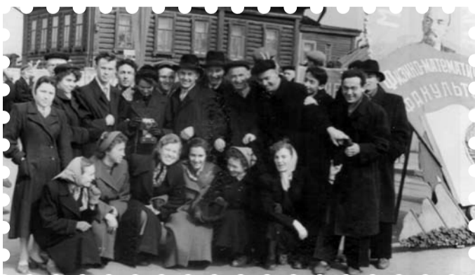
Студенты физико-математического факультета, 1949 год