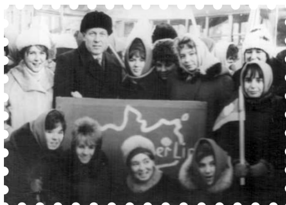
Студенты и преподаватели факультета иностранных языков на демонстрации, 1965 год