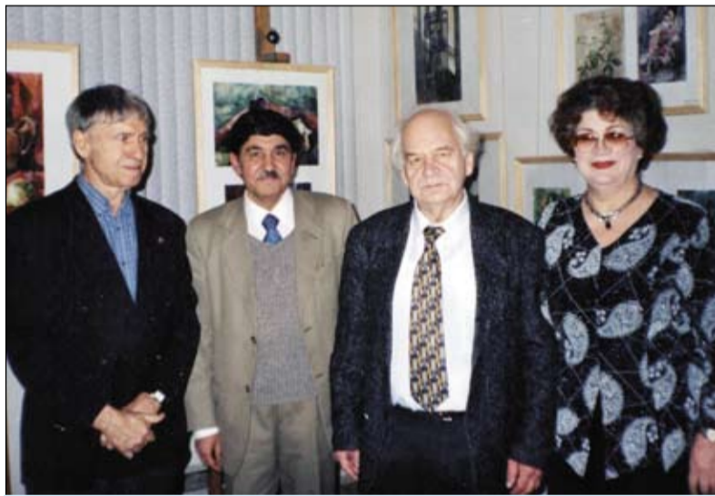
Встреча с Борисом Михайловичем Неменским