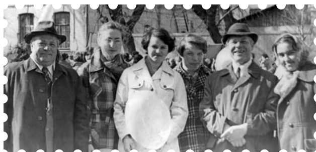
Преподаватели экономического факультета, 1978 год