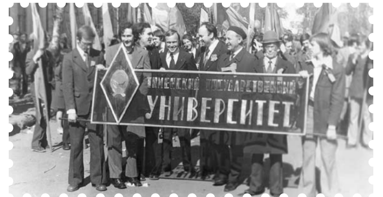
В колонне студенты и преподаватели историко-филологического факультета, 1973 год