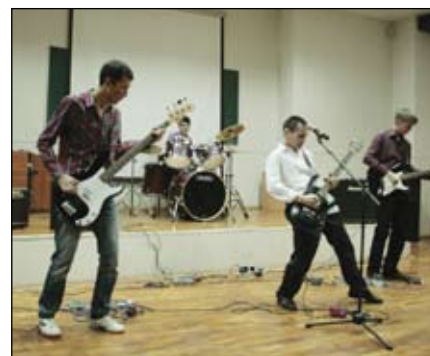
Фестиваль «Нота – 2013»

P.S. Хочу передать привет друзьям, Ямальской средней школе-интернату и своей родной семье!