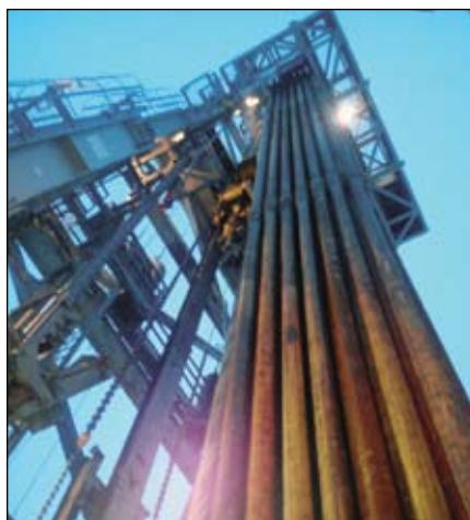
Вид на мачту изнутри буровой