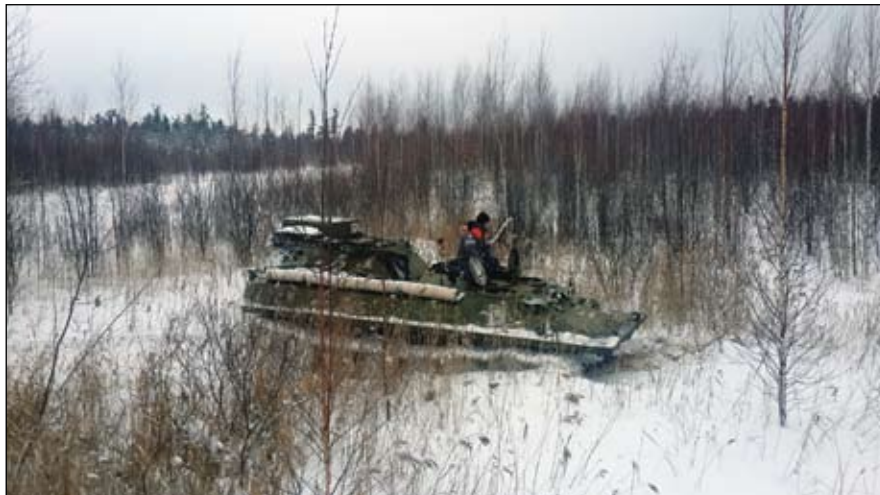
Полевой транспорт геологов - вездеход