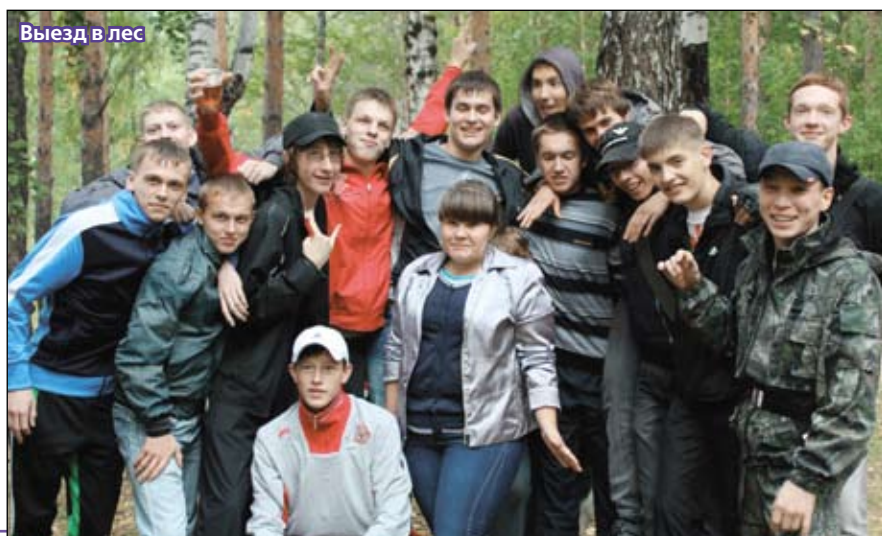
Выезд в лес