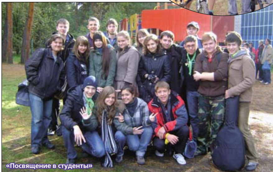
«Посвящение в студенты»