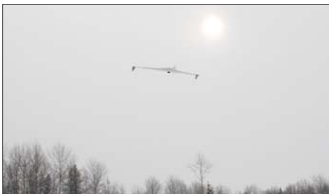
Специалисты Технопарка ТюмГУ проводят работы по мониторингу состояния трубопроводов в ООО «Газпромнефть-Хантос» при помощи такого современного летательного аппарата.