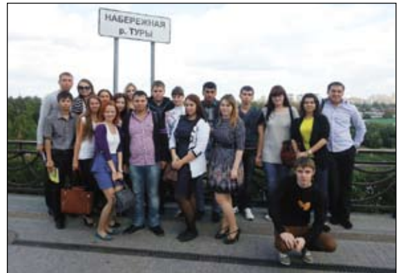
1 сентября с группой

- Пожалуй, курсе на втором, ведь на первом ты еще не так отчетливо понимаешь, как много делается для твоего развития, причем не только умственного, но и культурного. Проводится большое количество мероприятий, которые просто втягивают тебя в жизнь университета, не позволяя оставаться равнодушным. Но, пройдя экватор, понимаешь, что выбор был сделан правильно.