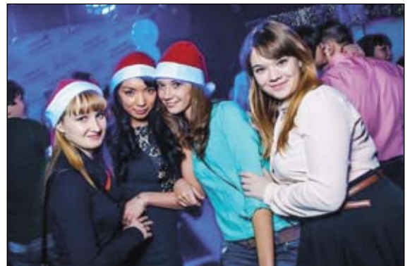
Отмечаем наступающий 2014 год