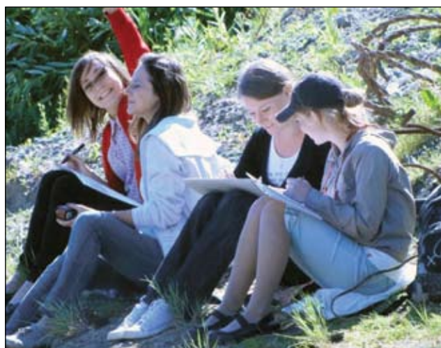
Пленер в Тюмени