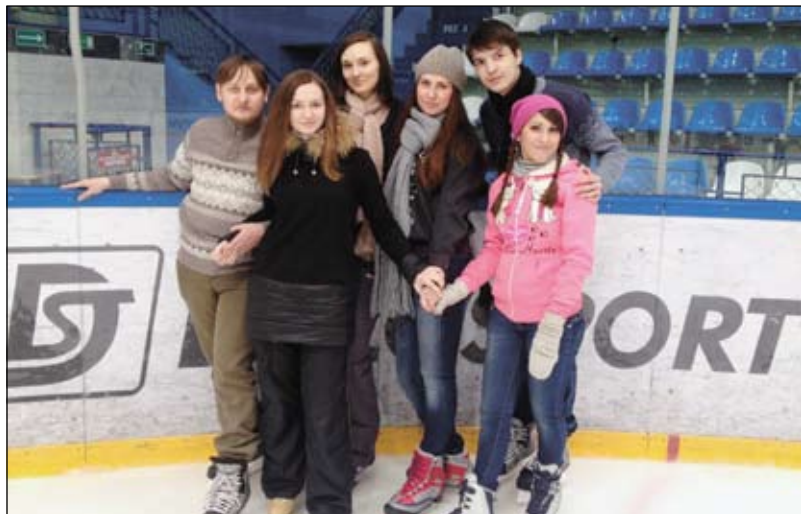
С группой на катке