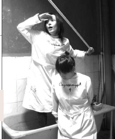
Дурачимся с одногруппницей

Честно говоря, на первом курсе не было полного осознания того, чего я хочу от обучения в институте. Скорее, была необходимость выполнения некоего плана: доучиться до пятого курса и защитить диплом. Но сейчас все по-другому. Участие в выставках различного уровня, общение с интересными, зрелыми художниками и умными людьми, работа по специальности и выход на высокий уровень в творческом плане отменили всякие сомнения в правильности выбора. У меня уже сформировалось осознание полной пригодности и ответственности за то, что я делаю и что хочу делать в будущем.