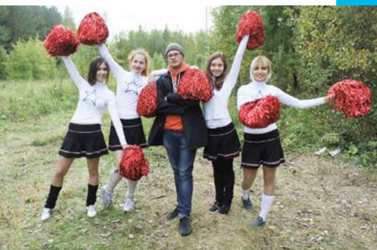
«Посвящение в первокурсники»

Хотите быть успешными? Получать высокую зарплату? Помогать людям? Стать отличным профессионалом? Специальным нарасхват? Тогда вам надо выбирать «Психологию». А может, и «Логопедию»... Или «Дизайн».