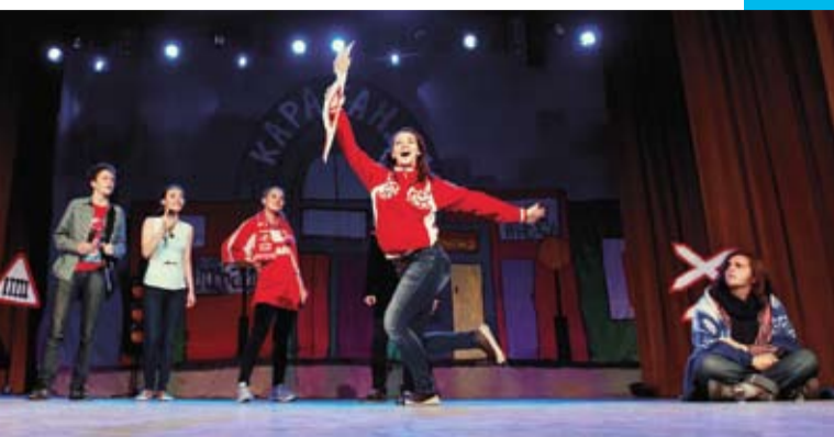
«Дебют - 2013»