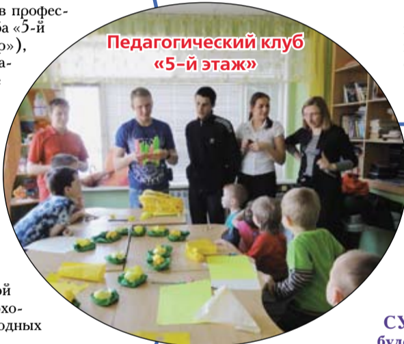
Педагогический клуб «5-й этаж»

ка от всех бед. К сожалению, и в нашей семье, как говорится, «не без уroda». Если почитать статьи про лихих тренеров, которые за четыре часа обещают изменить всю вашу жизнь. Будет ли трудновато двигаться без психолога? Люди без ноги тоже живут. Всегда ли нужны психологи? Психолог нужен ровно в тот момент, как вы сказали, что он вам нужен. И не важно, человек это говорит или организация.