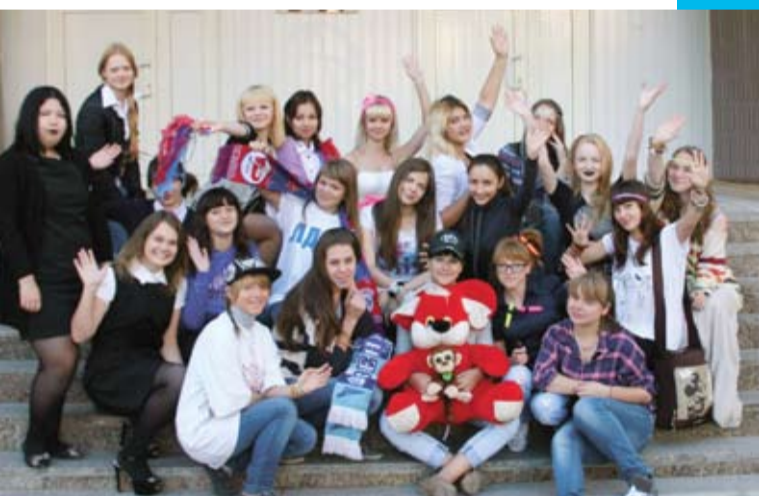
Фестиваль студенческих братств