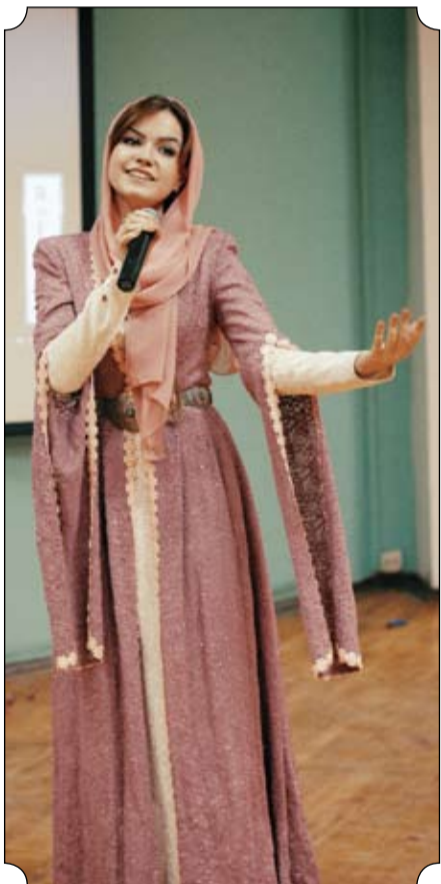
Чеченцы и ингуши спели невероятной красоты песню, от всей души угощали дорогих гостей своими национальными блюдами.