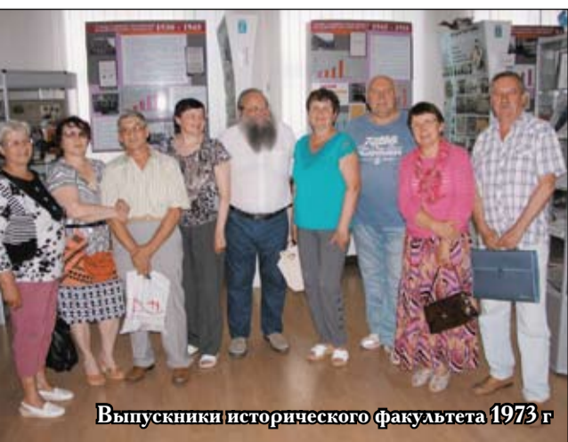
Выпускники исторического факультета 1973 г.

газете «Ленинец» по этому поводу писали: «Последние и первые. Как переплелись сегодня в университете эти слова. Последние экзамены, первые университетские дипломы. Здесь начало всех начал. Пройдут годы, каждый из них оставит свой след, но весна 1973 г. навсегда займет особое место в истории университета». Весной 1973 г. в торжественной обстановке были вручены дипломы 163 выпускникам