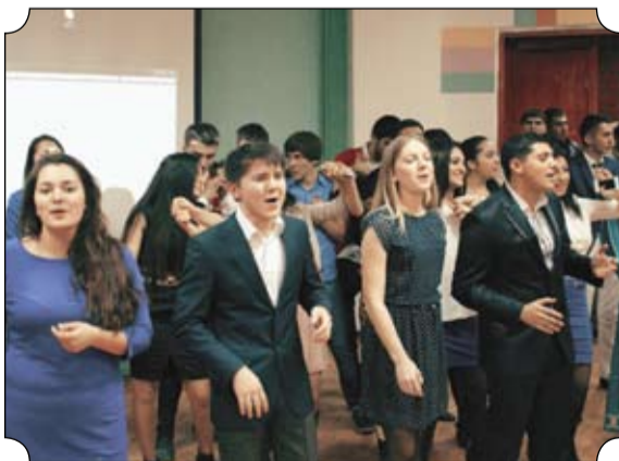
Выступление последней команды, представителями которой были ребята совершенно разных народов, стало логическим завершением всего праздника. Они показали, что границы государств существуют лишь на картах, в жизни их не бывает.