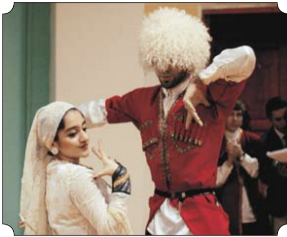
Ребята из Азербайджана танцевали лезгинку так, что весь зал был готов танцевать вместе с ними, настолько это было зажигательно.