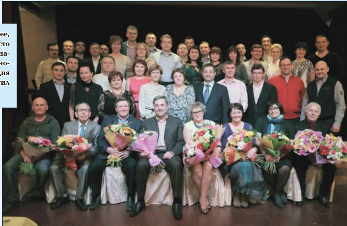
Вместе они - дружная семья, учителя и ученики. Одним словом, коллеги!

Я уходила с праздника раньше других. И унесла с собой частичку тепла и отличного настроения, которое дарили друг другу друзья на всю жизнь, выпускники-юристы 1993 года. И, кстати, они ведь не губернаторами и начальниками начинали свою жизнь в профессии. Шаг за шагом, ступенька за ступенькой они шли и идут по лестнице вверх. И при этом остаются, как и двадцать лет назад, молодыми и смешливыми. О, сколько невыдуманных историй от них услышала в этот вечер!..