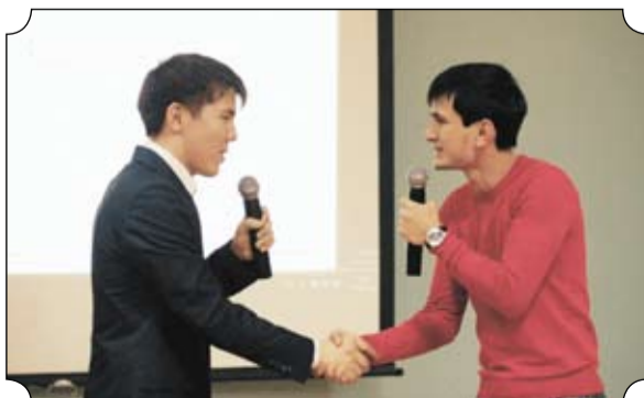
Теперь можно без преувеличения сказать, что День единения удался. Ведь дружба не имеет языка и цвета кожи, главное для нее - открытое и доброе сердце!