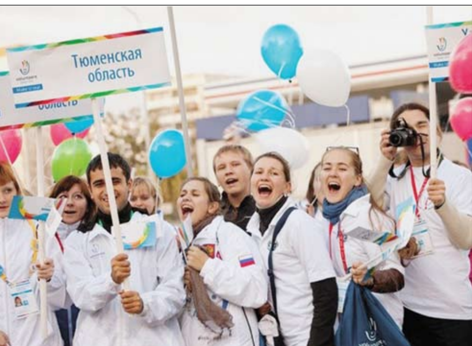
г.Казань. Международный волонтерский лагерь «Volunteer's Academy». Сборная Тюменской области