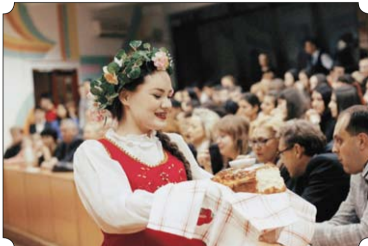
Участники команды России встречали всех хлебом да солью, а после спели со всей широтой русской души.