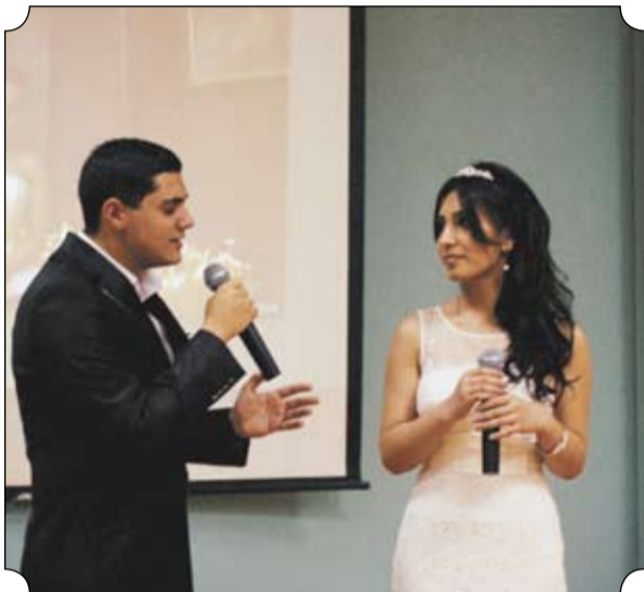
Представители Армении показали свадьбу с ее красивыми обрядами и мелодичными песнями.