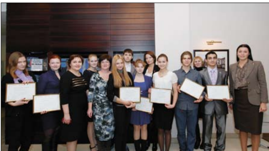
18 ноября состоялось награждение победителей конкурса на получение стипендии «Альфа-Шанс». Церемония была торжественной. На снимке - первые обладатели стипендии «Альфа-Банка».