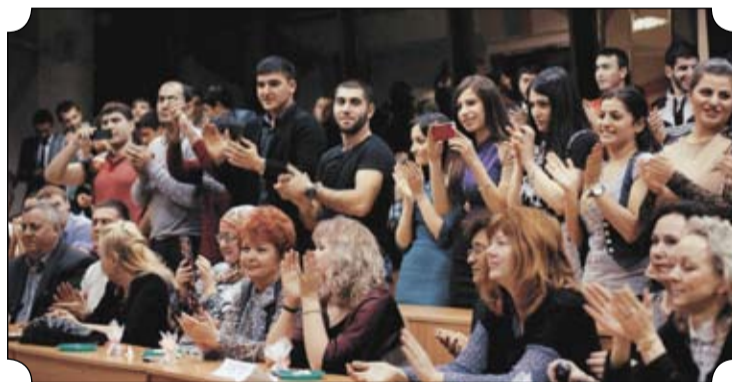
Зрители были не менее активны, чем участники команд. Они пели, пританцовывали, пробовали блюда, приготовленные мастерами, а самое главное - поддерживали выступающих своими аплодисментами. Кроме того, все они отметили, какое большое внимание было уделено таким деталям, как национальные костюмы и владение языком, звучание которого восхитило своей чистотой и красотой.