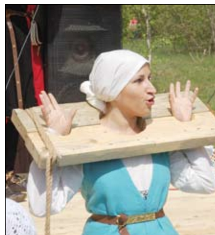
Обвинение в ведовстве

ти - гостей привлекли незнакомые, но сразу же полюбившиеся настольные игры позднего средневековья: «Лиса и Гуси», «9 танцующих мужчин» и карточная игра «Баккара». Не оставило никого равнодушными искусство плетения поясов и тесьмы на дощечках и шнурков в технике фингерлуп («плетение на пальцах») от мастерицы Людмилы Козловой из клуба «Бамберг». Но, вероятно, самым популярным оказался аутентичный средневековый гончарный круг, на котором с помощью керамистки Анны Болдиной можно было изготовить тарелочку или кружку. Кроме того, можно было научиться танцевать средневековый Бранли или пои-