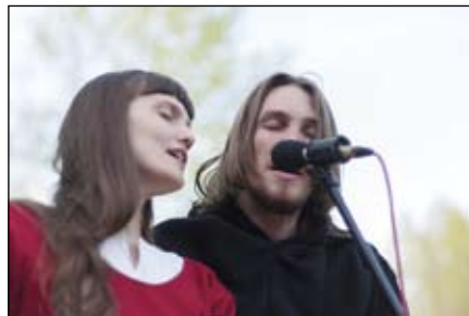
Выступление Гилеад

Множество площадок задали фестивалю весьма интенсивный ритм. Наряду с русскими и западноевропейскими воинами, сходящимися в бескомпромиссных индивидуальных и групповых боях, можно было детально рас-