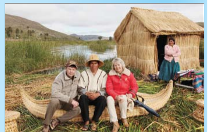
В гостях у индейцев кечуа на озере Титикака. Боливия