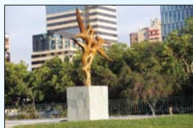
Чили. Сантьяго. Парк скульптур