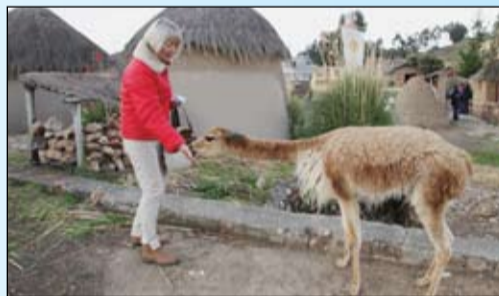
Никто не против полакомиться, даже дикая викунья. Боливия