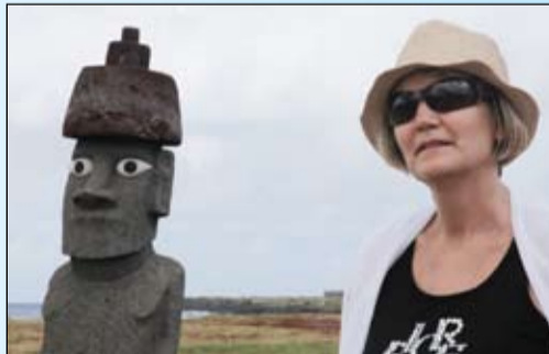
Остров Пасхи (Чили). Говорят, мы похожи