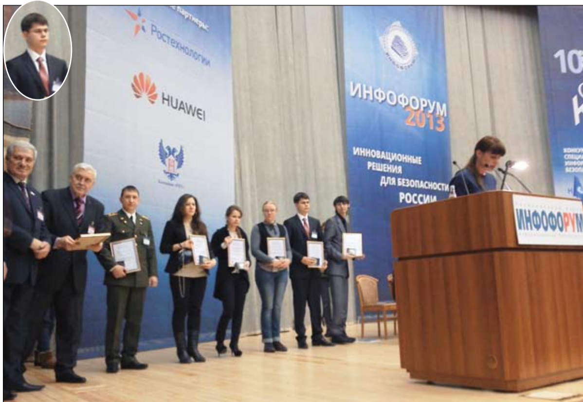
На столичной сцене

В его выпускном дипломе будет записано «Специалист по защите информации». Здорово и современно. А работает наш герой в Тюменской компании «Виндекс» простым инженером. И собирается поступать в аспирантуру.