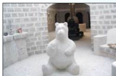
Боливия. В боливийских солончаках и отель из соли