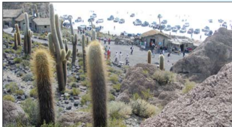
Боливия. Кактусовый оазис в солончаках