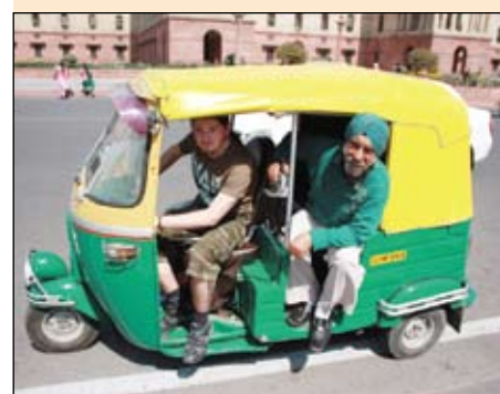
Роман Комсюков дебют в номинации «Фото» за работу «Невероятная Индия - невероятные люди»

Вот почему мы говорим по телефону «Ну всё, давай, пока»? Что значит это слово «давай»? всю жизнь так говорил, никогда не задумывался и задумываться бы не стал! Ну, всё же и так понятно: «давай» значит... «давай», ну то есть «давай клади трубку» или... «делай» или... честно говоря, до сих пор у всех спрашиваю, что это значит. Никто ещё не ответил, никто об этом не думал.