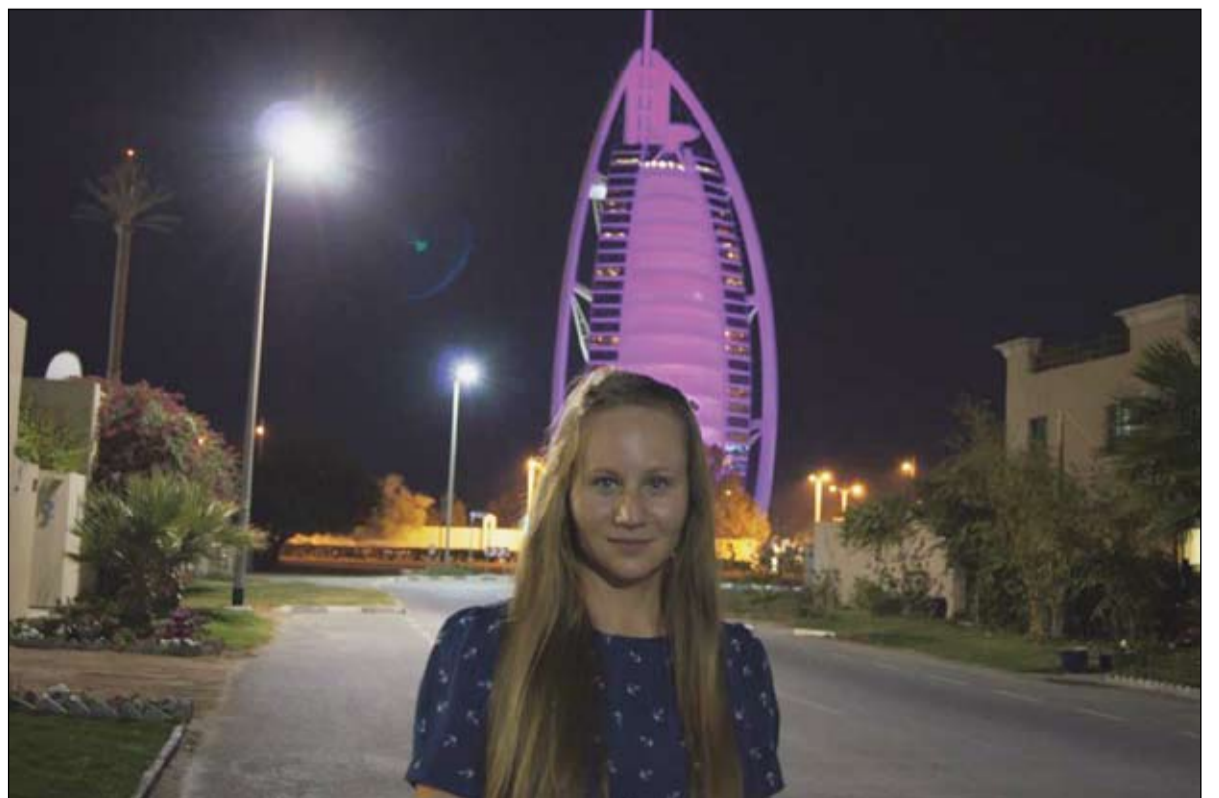
В Дубае, на берегу моря, всегда отличная погода!

- А когда вы успевали изучать технологию бурения?