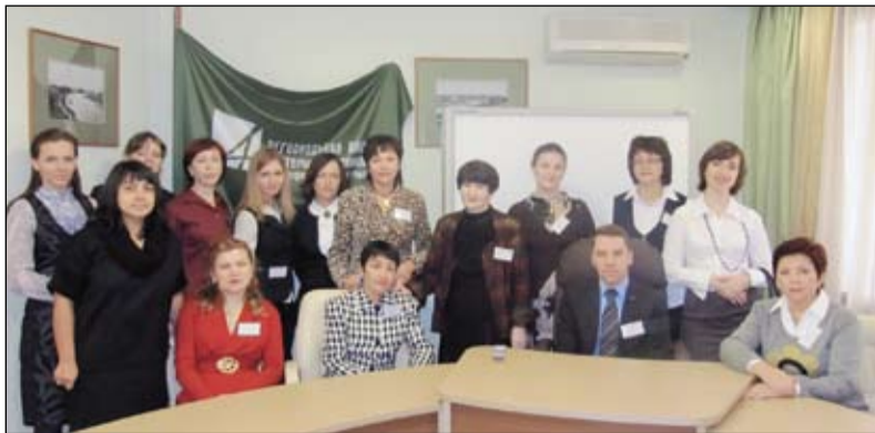
Международная конференция в ООО «РАСТАМ» совместно с кафедрой учета, анализа и аудита ТюмГУ

За добросовестную работу и заслуги в образовании сотрудники кафедры награждены почетными грамотами и благодарностями Министерства образования, Тюменской областной думы, губернатора области, УМО вузов России по образованию в области финансов, учета и мировой экономики, Управления ФНС по Тюменской области, руководства университета.