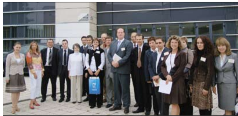
Участие в международной конференции, г.Мец, Франция, университет Поля Верлена

СИРА). Словом, кафедра вышла на новые более высокие уровни подготовки специалистов и постоянно возрастающие потоки студентов и слушателей свидетельствуют, что эта подготовка соответствует требованиям современного образования.