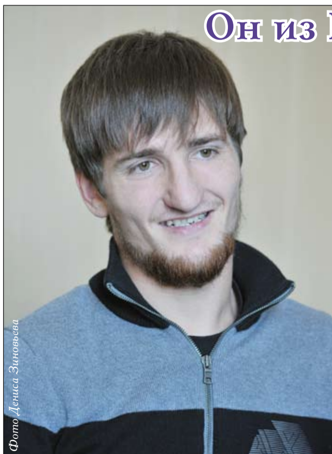
Фото Дениса Зинovieва