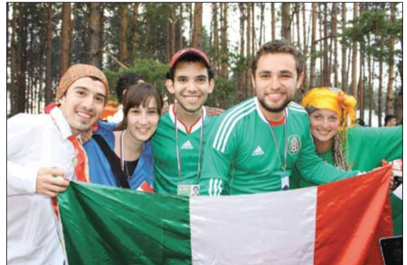
С делегацией Мексики

Окончила бакалавриат по направлению «Международные отношения» в 2011 году. В совершенстве владеет английским языком. Уже побывала в США, Великобритании и Норвегии. Мечтает объехать все страны за 80 дней