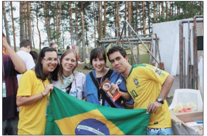
С делегацией Бразилии

студентов в российское общество и повышение международной мобильности российских студентов.