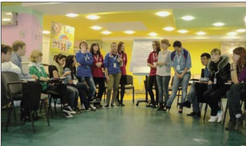
Площадка «Межкультурный диалог»

Да, молодежные форумы - это порой именно то, чего не хватает активному молодому человеку в его повседневной жизни. Вот только недавно прошел Форум молодежи УФО «Актив 2011», где я и мои друзья уже не участники, а организаторы целой площадки «Межкультурный диалог». Размах, конечно, не такой, как на «Селигере», но здесь главное - упор на качество и тот опыт, который могут передать приглашенные эксперты своим молодым коллегам в области профилактики ксенофобии, налаживания межкультурных связей, интеграции иностранных