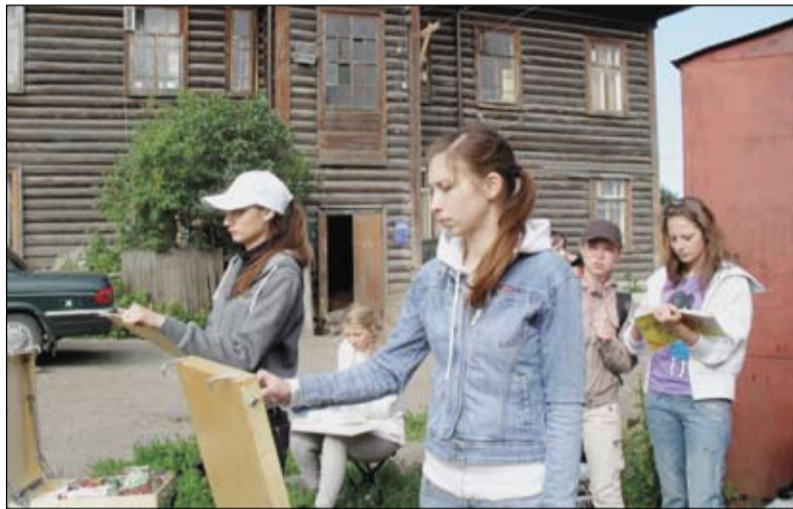
В старой Тюмени.

ем выставки и пожелал ее участникам дальнейшего повышения мастерства в своем творчестве и проявления душевной радости в работах.