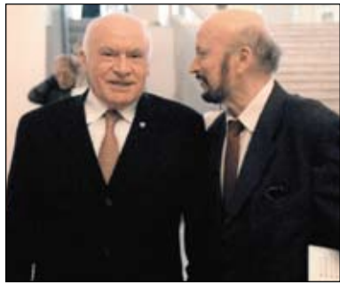
С Лео Бокерия

должность завкафедрой и имеется перспектива ее занять. Так и произошло.