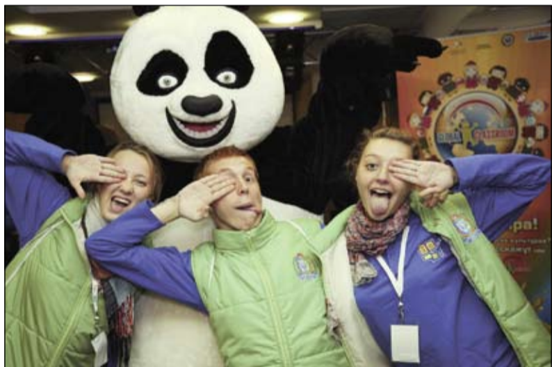
Международный вечер культурного разнообразия

Сегодня, как никогда, остро стоит проблема взаимодействия различных культур и религий, чьи ценности различны и часто кажутся несовместимыми друг с другом. Поэтому речь о межкультурном диалоге столь актуальна на таких молодежных форумах, как «Актив», который в 2012 году вновь соберет неравнодушных молодых людей и продолжит работу по формированию межкультурных компетенций. Пока же участниками форума 2011 года было решено создать неформальную сеть молодежных лидеров, активных в сфере формирования гражданского общества и межкультурного диалога. Одним из первых мероприятий в рамках образованного сообщества станет обмен визитами ТюмГУ с Ассоциацией молодежных этнокультурных объединений Свердловской области.