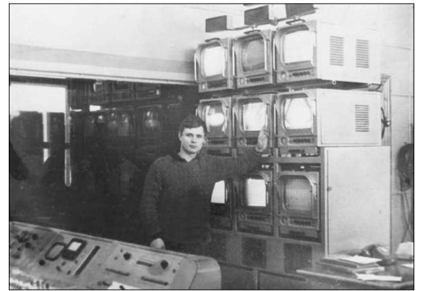
В режиссерской аппаратуре, 1968 год