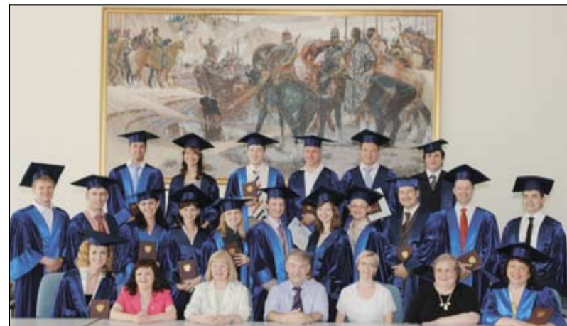
Первый выпуск мастеров делового администрирования

73. 2008, июнь. ТюмГУ вручил дипломы первому в истории Тюменской области выпускнику мастеров делового администрирования. 24 представителя бизнес-элиты области в течение двух лет занимались по совместной программе ведущего вуза региона и университета г. Вулверхемптона (Великобритания).