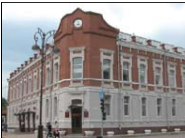
Информационно-библиотечный центр ТюмГУ

62. 2001, декабрь. Состоялось открытие Информационно-библиотечного центра ТюмГУ по адресу: ул. Семакова, 18.