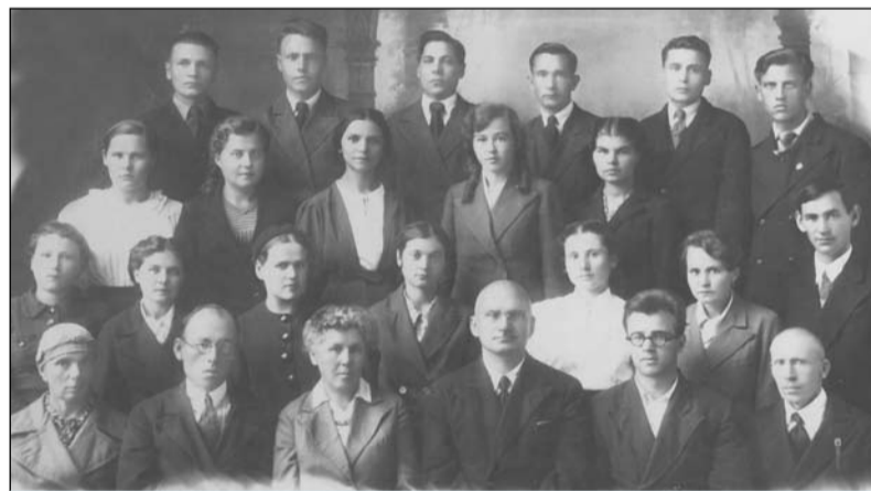
Ускоренный выпуск физико-математического факультета. 1941 г.

19. 1941, ноябрь. Состоялся внеочередной военный выпуск ТГПИ.