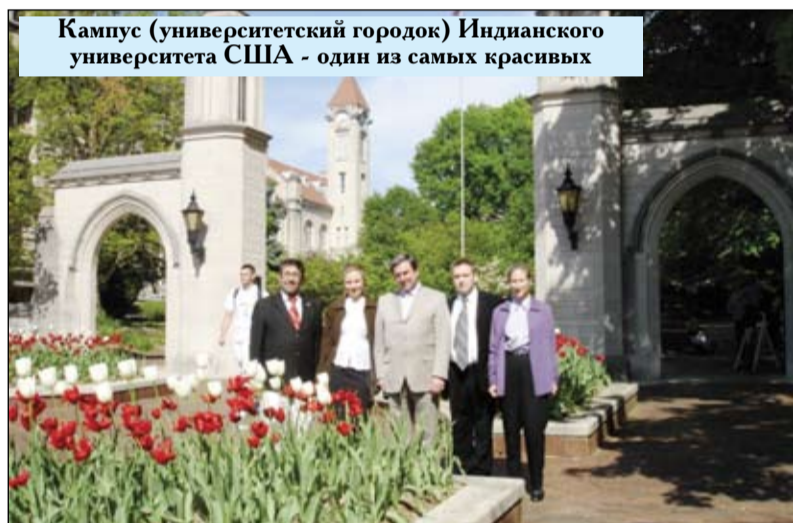
Кампус (университетский городок) Индианского университета США - один из самых красивых