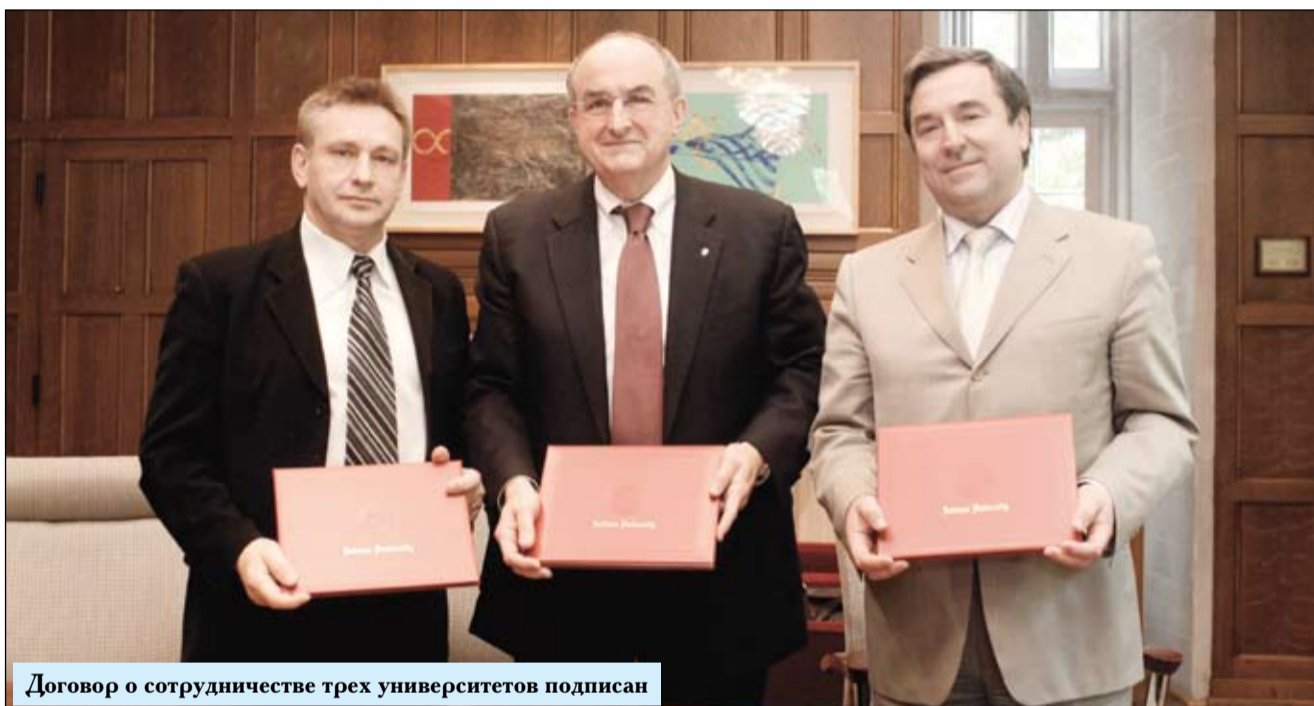
Договор о сотрудничестве трех университетов подписан