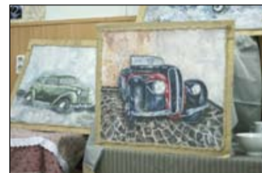
Ретро-мобили военных и послевоенных годов.

Творчество студентов ИГиПа ТюмГУ продолжается. В ближайшее время они планируют организовать выставку, посвященную Победе в Великой Отечественной войне. «Мы не относимся к прошлому, как к чему-то чужому, далекому и давно прошедшему, - говорят они. - Мы любим старинные вещи и питаем к ним уважение. У всех старинных вещей своя энергетика. А на фотографиях взгляд наших ровесников чище и светлее: им меньше приходилось выбирать и где-то ломать себя. Побывать бы в том мире...»