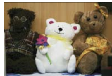
Игрушки из ткани, мохера, плюша. Автор Светлана Пахвицевич