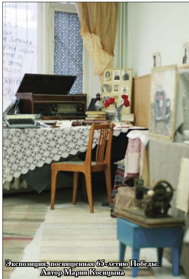
Экспозиция, посвященная 65-летию Победы. Автор Мария Косицына