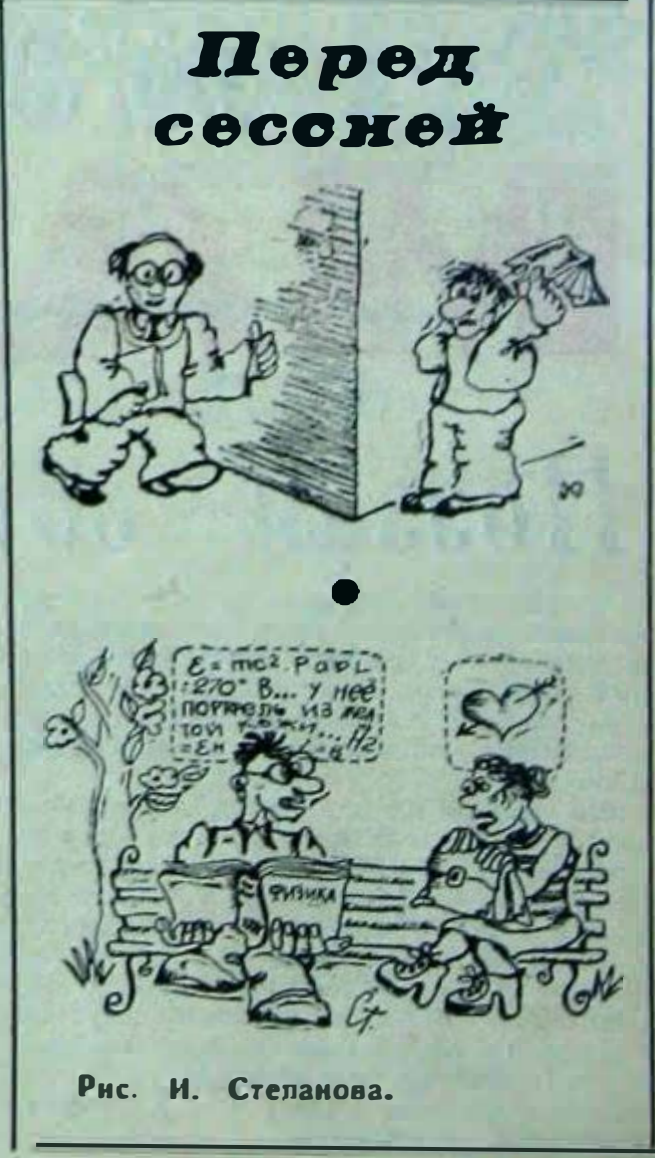
Рис. И. Степанова.

И мой маленький шар головной Превзошел грандиозный — земной. Подчинилась земля мне, и я Одарил ее красотой. Земля сотворила меня, Я же землю пересотворил — Новой, лучшей, прекрасной — такой Никогда она не была! В шар земной упираюсь ногами, Солнца шар я держу на руках. Я — как мост меж землей и солнцем, И по мне Солнце сходит на землю, А земля поднимается к солнцу. Обращаются вокруг меня Ярко-пестрою каруселью Все творения, произведенные, Изваяния рук моих: Города вокруг меня кружатся, И громады домов, И асфальт площадей, И мосты, что полны машин и людей. Самолеты и лайнеры — вокруг меня, Трактора и станки — вокруг меня... И ракеты арашаются вокруг меня... Так стою: Прекрасный, мудрый, твердый, Мускулистый, плечистый. От земли вырастаю до самого солнца И бросаю на землю Улыбки солнца. На восток, на запад, На север, на юг. Так стою: Я, человек, Я, коммунист.