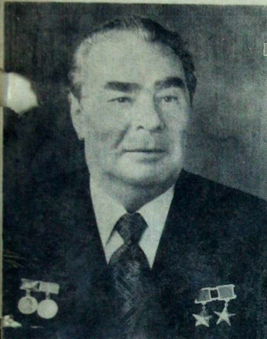
Леонид Ильич Брежнев.

Дорогой Леонид Ильич! В этот торжественный, волнующий день 35-миллионный Ленинский комсомол горючо и счастливо поздравляет Вас, выдающегося революционер-ленинца, признанного вождем партии и народа, крупнейшего политического деятеля современности, мудро и доброго инстинктом молодежи, со славным юбилеем!