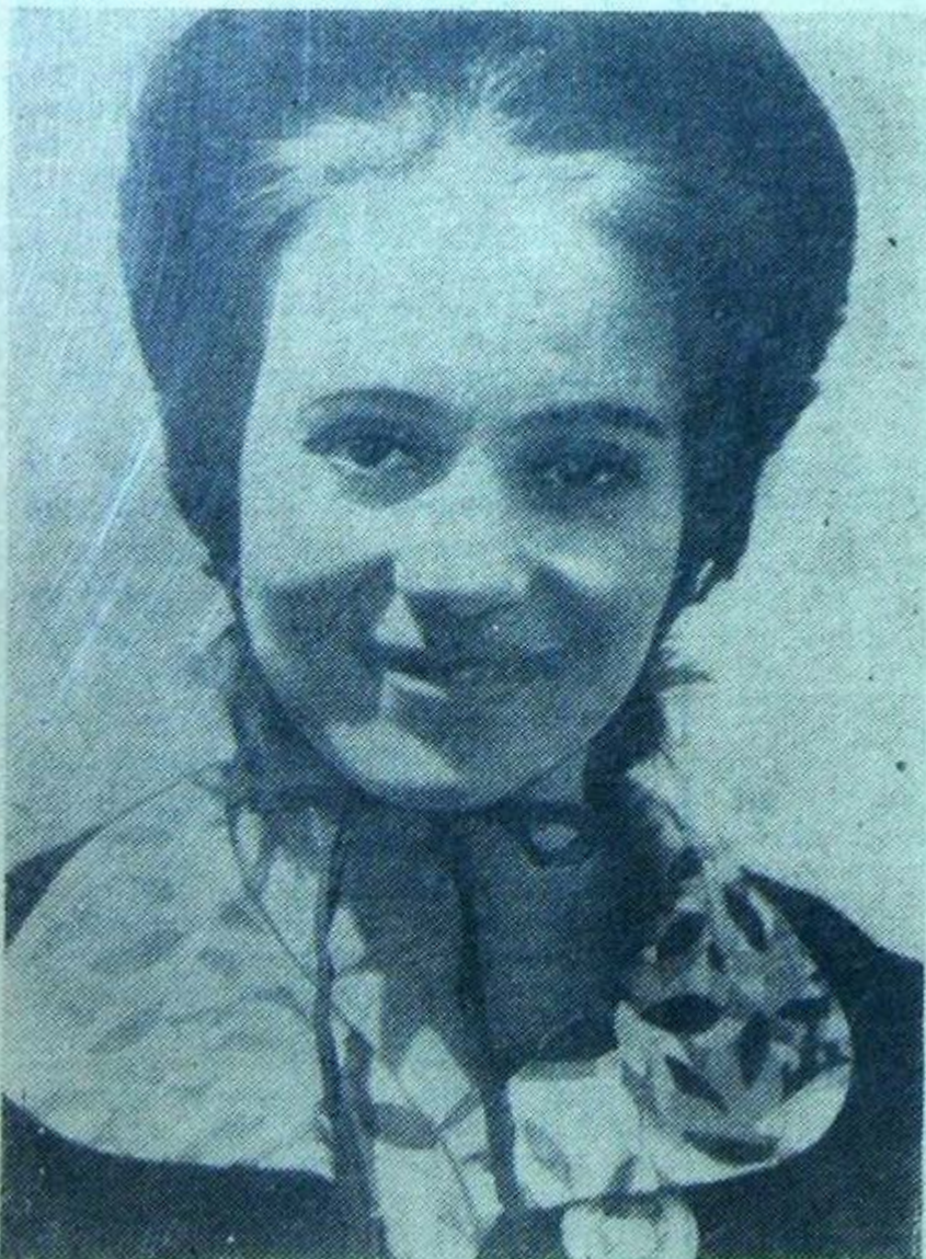
Ну что за праздник без улыбки...