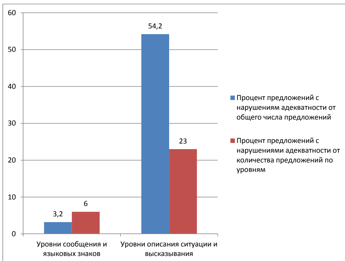
Рисунок 1. Процентное соотношение предложений с отклонениями в адекватности на различных уровнях эквивалентности

Это можно объяснить тем, что на более высоких уровнях эквивалентности переводятся в основном простые предложения, либо сложносочиненные, не осложненные конструкциями и оборотами, без тропов и фигур, проблемных для перевода, что и снижает вероятность нарушения адекватности.