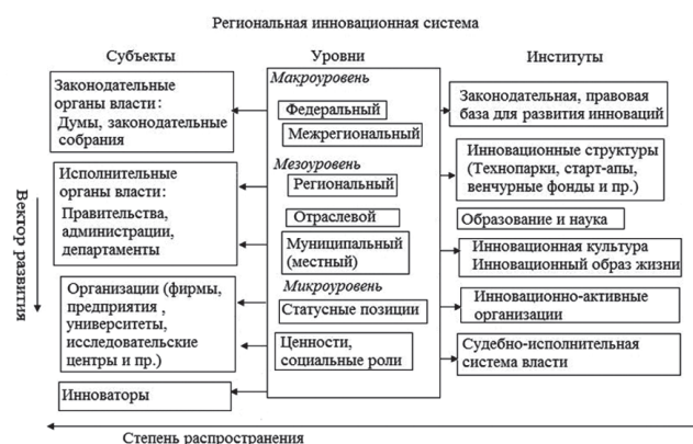
Рис. 2. Региональная инновационная система

Институциональная среда может быть направлена на развитие инноваций, а может служить ограничением, даже напрямую тормозить их.