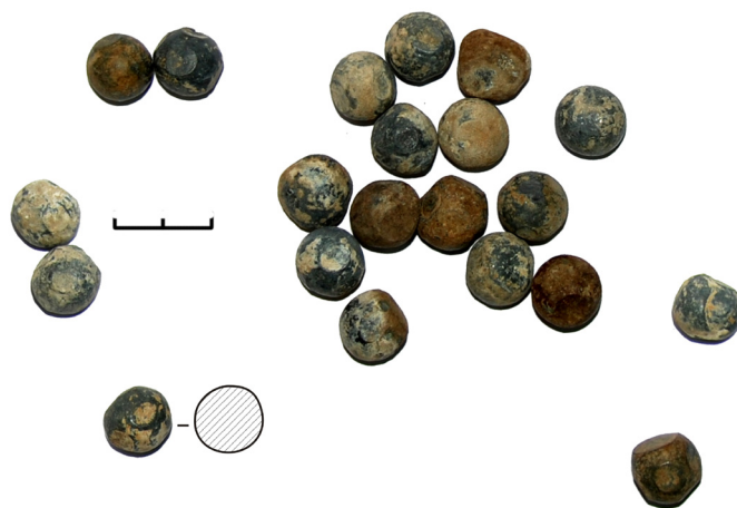
Рис. 4. Пищальная картечь с места боя казаков с войском Карачи

Сами пули изготовлены из свинца и имеют диаметр около 13-15 мм, некоторые деформированы, по-видимому, от удара о твердую поверхность. На одном