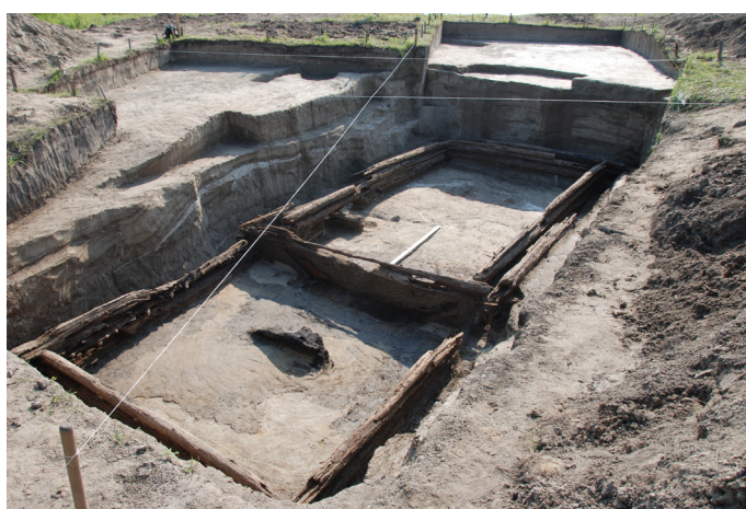
Рис. 6. Вид на срубное жилище сибирских первопроходцев на Карачинском острове