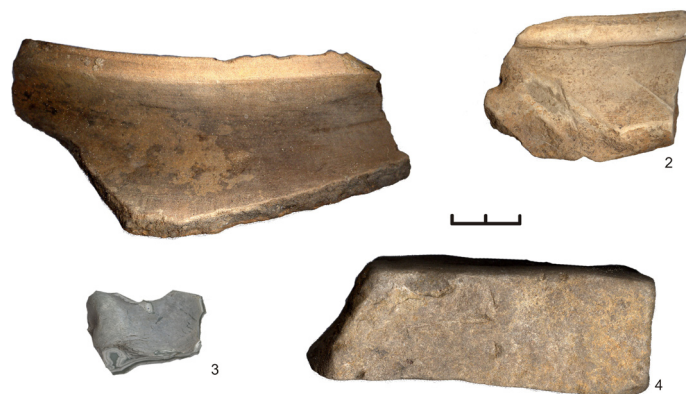
Рис. 5. Находки из землянки сибирских первопроходцев на Карачинском острове