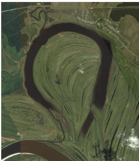
Рис. 2. Космоснимок Карачинского острова с указанием мест археологического поиска

Отождествление этого географического объекта с местом сражения и зимовки дружины Ермака предполагало открытие археологических свидетельств этих событий (рис. 2). Исследование осложняло то обстоятельство, что из-за отсутствия достоверных сведений о местоположении казачьего лагеря изыскания предстояло провести на всей площади острова, неоднократно затапливавшегося и интенсивно распаивавшегося, что, конечно же, снивелировало археологические объекты.