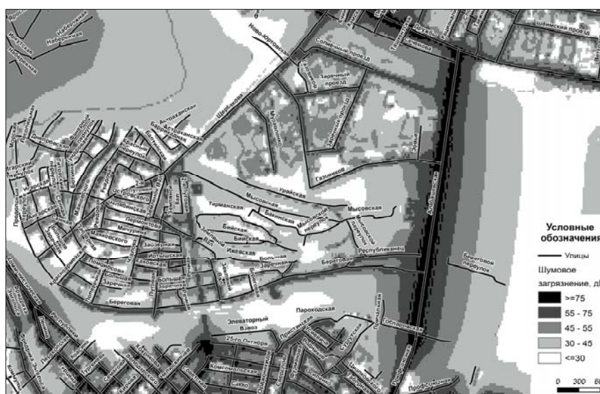
Рис. 2. Шумовое загрязнение микрорайона «Заречный»