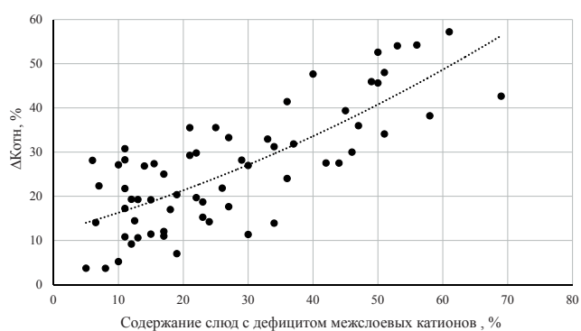
Рис. 2. Влияние содержания слюд** на изменение проницаемости при смене минерализации от 1 г/л до пластовых значений (16-20 г/л)