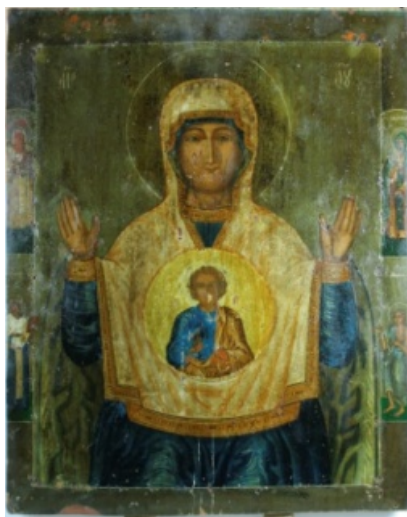
Рис. 3. Икона 1703 г., происходящая из церкви Успения (Третьяковская галерея)

Икона из Третьяковской галереи (инвентарный № 22129 КП № 8809) выполнена в 1703 г. и происходит из церкви Успения с. Витенево Московской области (рис. 3). Есть и надпись на нижнем поле: «...лета СІВ (1703) писанъ сей