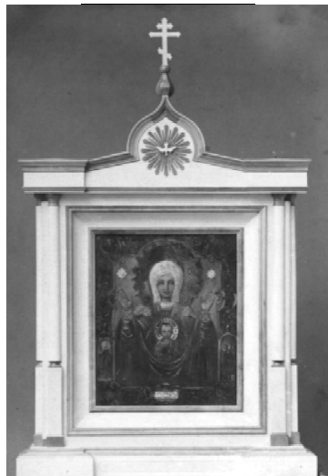
Рис. 5. В. Л. Туленков. Абалакская икона «Знамение» в киоте. Конец XIX в. ТОКМ ОФ-1593/4 инв. № Ф-63.

Самая почитаемая святыня Сибири имела значение и для Царской семьи, сопровождая ее (вместе с другими реликвиями) в последний год жизни. Известна судьба иконы, перед которой молилась семья Романовых в Рождество Христово 1917 г., но факт ее присутствия отражен в дневниках последнего российского императора. А ведь существовали и другие «Абалакские»: в 1913 г., в связи с 300-летием Дома Романовых, депутацией Тобольской губернии подарен ее список [16, с. 50]. Дело в том, что задолго до этого, на заседании комиссии