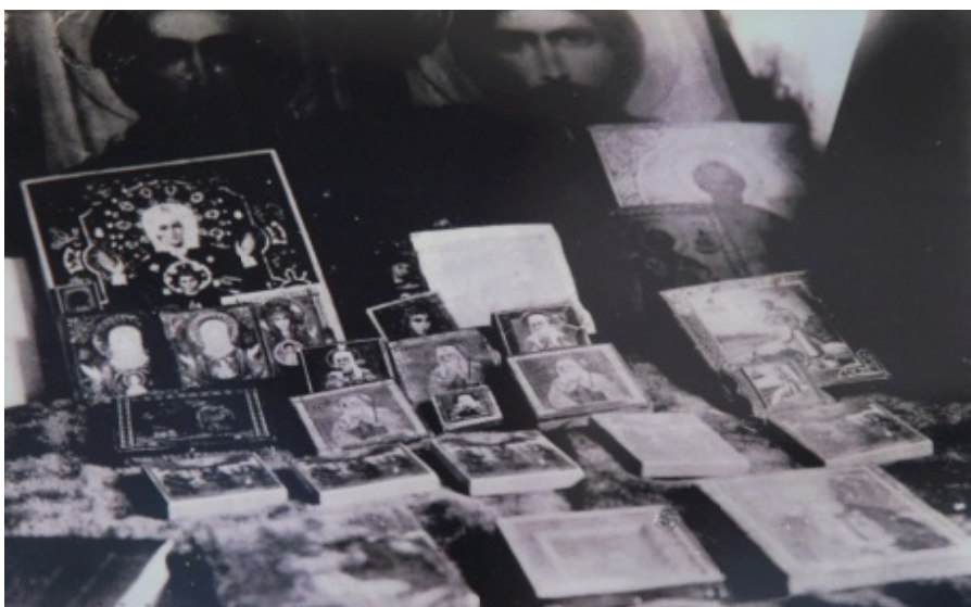
Рис. 6. Иконы, принадлежавшие Царской Семье. Государственный архив РФ. Фото было представлено в экспозиции Духовно-просветительского центра «Царский» в Патриаршем подворье Храма на Крови (г. Екатеринбург, 2013)

Несмотря на то, что оригинал утрачен, сохранившиеся списки, как и материалы, говорят, что икона всегда была почитаема.