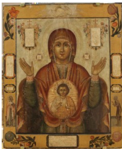
Рис. 2. Абалакская икона, происходящая из храма Ильи Пророка (собрание Ярославского музея-заповедника первой трети XIII в.)

Редкой считается Абалакская икона из собрания Ярославского государственного музея-заповедника первой трети XVIII в. (рис. 2), происходящая из по-