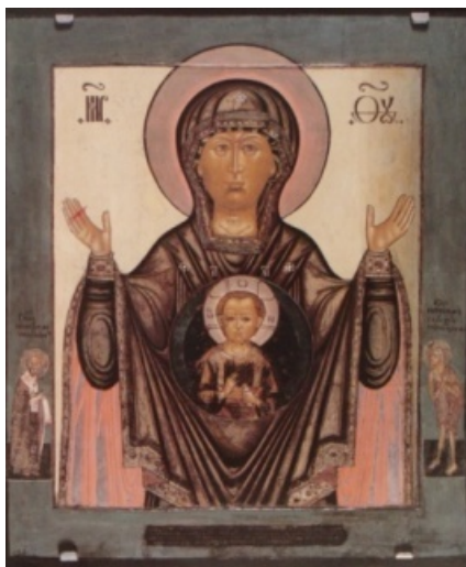
Рис. 4. Икона «Богоматерь Абалакская» XVIII в. (древлехранилище Тобольской Митрополии РПЦ МП)

Почитание Абалакской иконы сложилось и в той части Сибири, что отошла в состав Казахстана. В связи с этим примечательна дата — 20 мая 1720 г., когда генерал-майор Лихарев с воинской командой отправился из Томска вверх по Иртышу до озера Нор-Зайсан и далее, для построения Усть-Каменогорской крепости. В пути сделана остановка напротив с. Абалак. Тогда копия чудотворной иконы и была принесена на судно. Как полагалось накануне длительного и опасного предприятия, перед иконой отслужили молебен. Далее с этим путе-