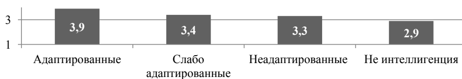
Рис. 2. Соотношение успешности социальной адаптации и уровня политического самосознания интеллигенции по 5-балльной шкале