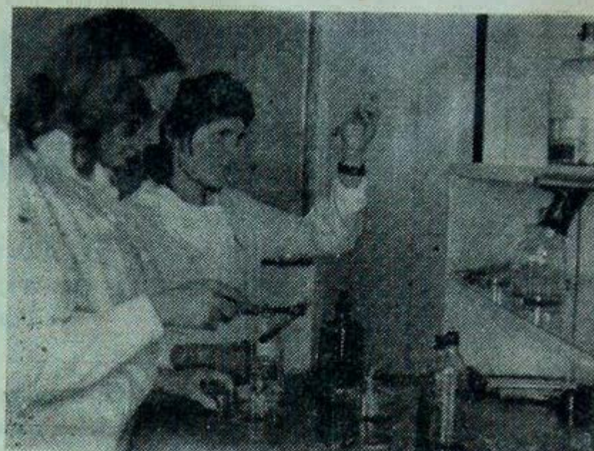
Студенты химико-биологического факультета на занятиях в лаборатории.