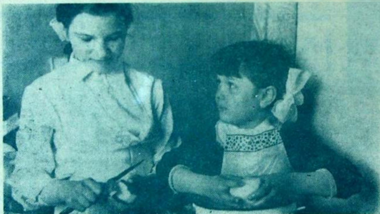
ГОТОВИМСЯ К ПРАЗДНИКУ!