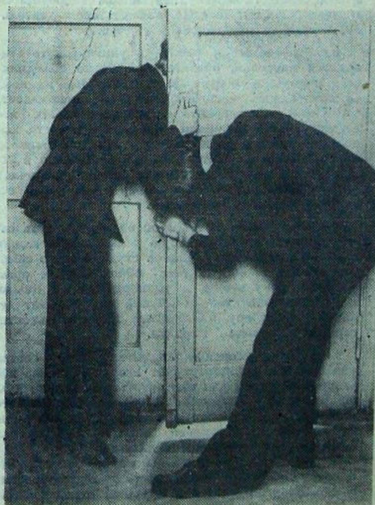
ЧТО ТАМ ВПЕРЕДИ?