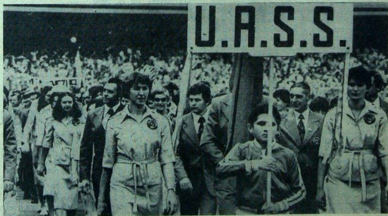
В столице Мексики проходят X Всемирные студенческие игры. На снимке: делегация Советского Союза — участница Универсиады-80.

В этом году у нас нововведение: на каждом этаже будет установлен стол дежурного. Студенты будут сдавать сюда ключи от своих комнат, здесь можно будет узнать номер телефона любой службы быта, расписание самолетов, поездов, автобусов, дежурить будут сами студенты. Это значительно облегчит работу вахтеров, да и студенты больше будут чувствовать себя хозяевами общежития, а значит, бережнее будут к нему относиться.