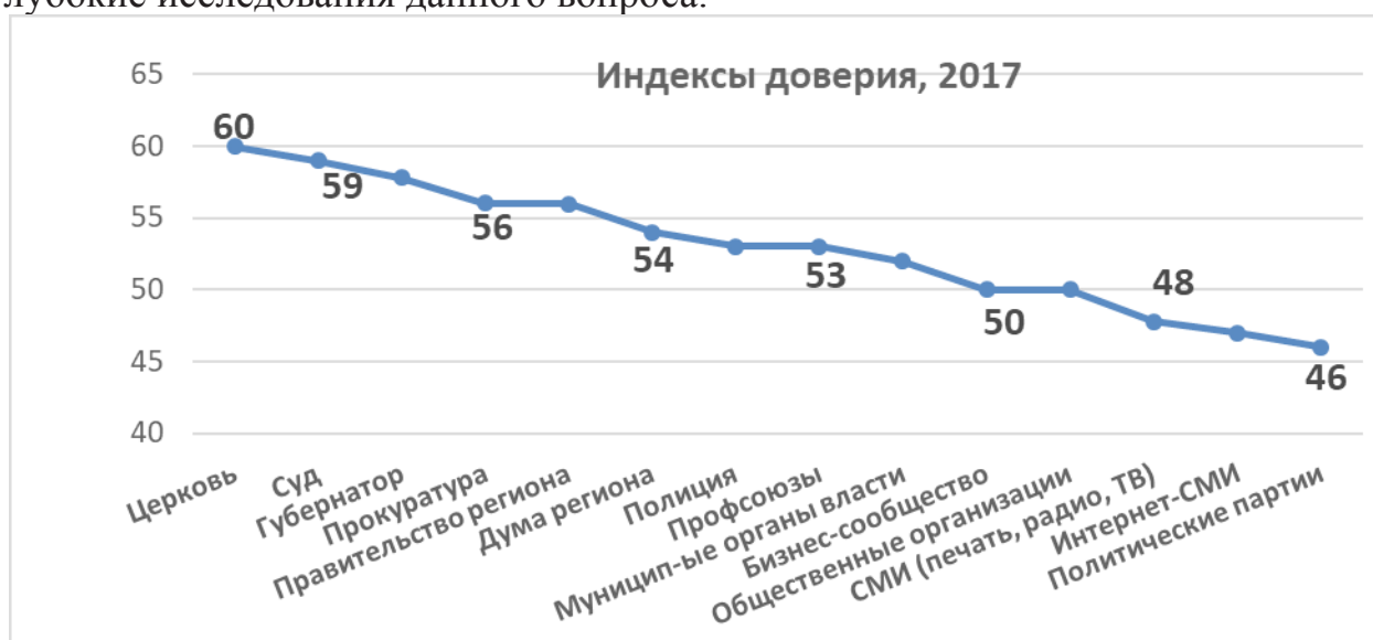
Рис. 1. Индексы доверия*, 2017.

В 2017 году в зоне превышения доли доверяющих над долей недоверяющих находятся 12 институтов и социальных структур из 15. У лидеров рейтинга доверия эта разница превышает 20%. Динамику указанных показателей можно интерпретировать с разных позиций: с одной стороны, рост доверия отражает действительное улучшение работы изучаемых институтов; с другой стороны – результат высокоэффективной работы средств массовой информации. Нельзя отрицать, что рост поддержки населением институтов власти стал следствием всплеска патриотизма, который наблюдался в 2015 году, что это определенный кредит населения власти в ситуации нестабильности и враждебного внешнего окружения. В любом случае, для адекватной оценки детерминант доверия – недоверия к институтам имеет смысл провести более глубокие исследования данного вопроса.