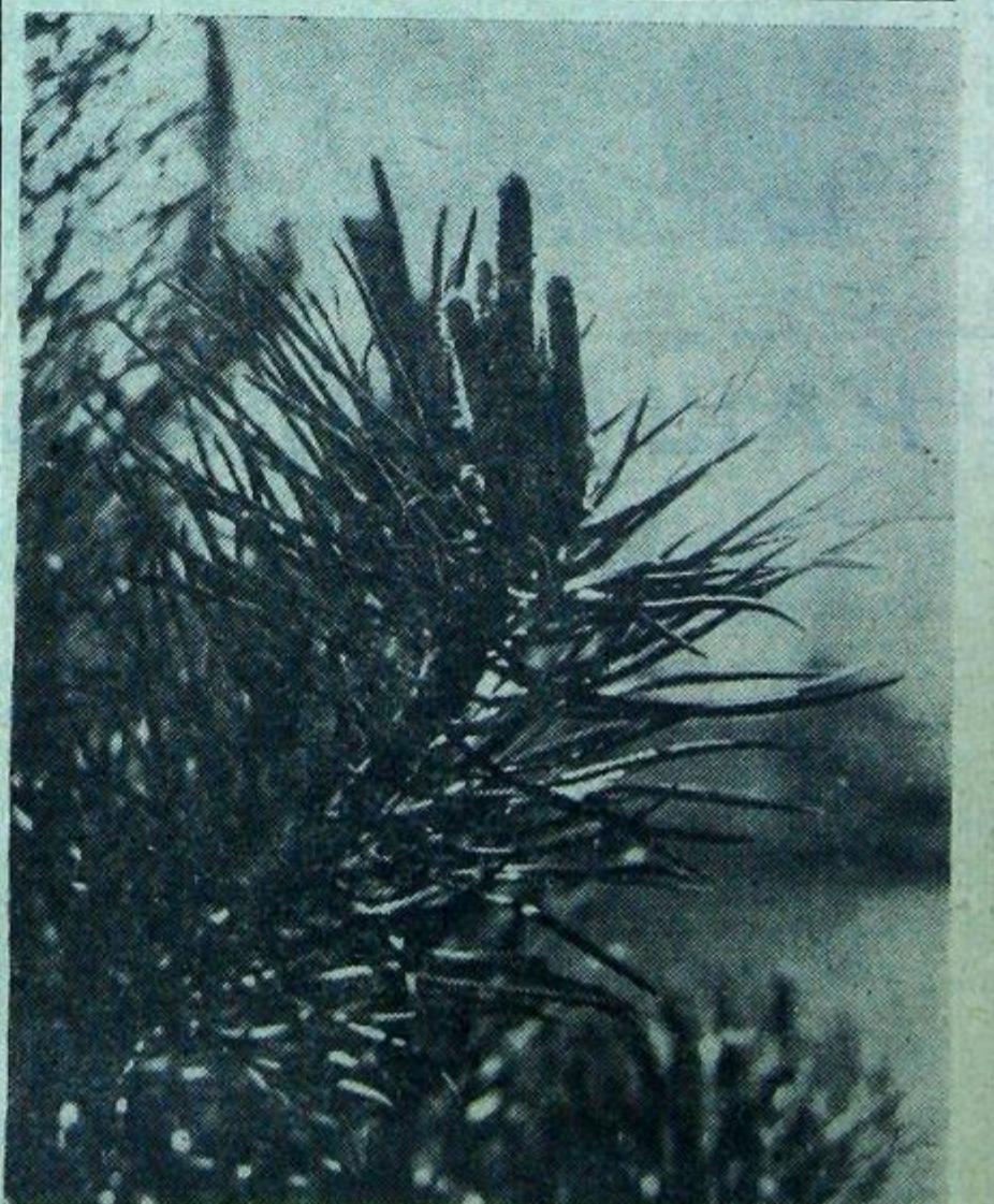
«И ВЛАЖНОЙ ВЕТКОЙ ФЕВРАЛЯ ЗИМА КАЧНЕТ ПЕРЕД УХОДОМ...»

По-моему было бы очень неплохо, наряду с курсом «Введение в специальность», читать студентам лекции по научной организации труда. И вообще нужно учить их продуктивно работать.