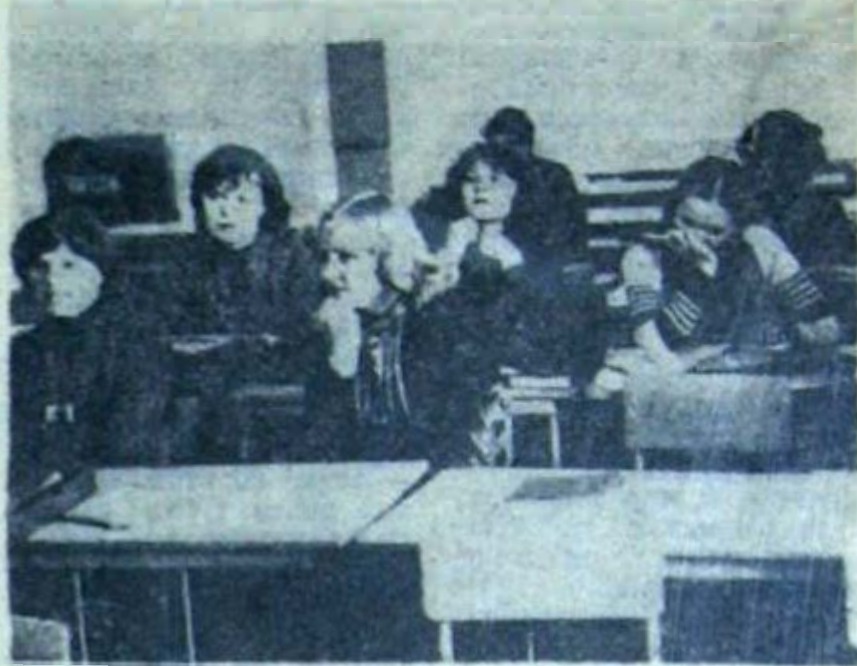
В комсомольских группах университета началось изучение материалов XXVI съезда партии. По первому разделу Отчетного доклада ЦК КПСС прошли групповые политинформации.